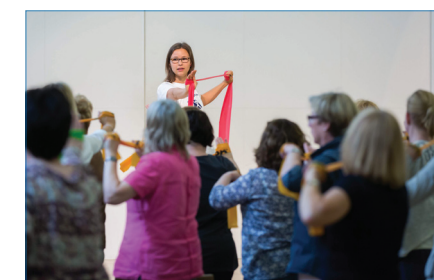
Der „JLU-Pausenexpress“ beim Office Day 2016.

Wir danken all unseren treuen und aktiven Teilnehmerinnen und Teilnehmern und freuen uns auf die weiteren bewegten Jahre mit Ihnen.