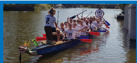
Hoch die Hände: Die UNI-Drachen nach getaner Arbeit.

Der 15. Gießener Drachenboot-Cup fand am 18. August 2018 erstmals unter Beteiligung der UNI-Drachen statt. Gleich bei ihrer ersten Regatta erpaddelte sich das JLU-Team einen hervorragenden 4. Platz im „Fun-Cup“-Rennen. Die erfolgreiche Truppe formierte sich aus dem ahs-Kurs „Drachenbootfahren“, welcher im Sommersemester 2018 neu in das Sportprogramm aufgenommen wurde. Der Kurs findet in Kooperation mit dem WSV Hellas Gießen statt.