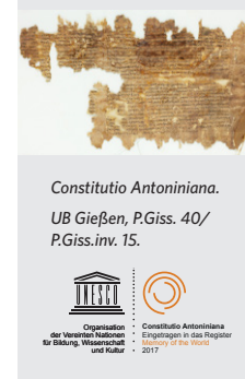
Constitutio Antoniniana. UB Gießen, P.Giss. 40/ P.Giss.inv. 15.