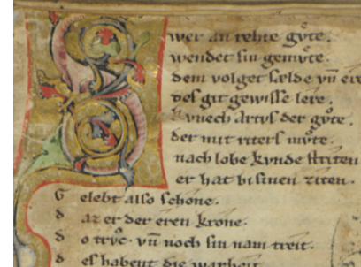
Hartmann von Aue: Iwein. Süddeutschland, zweites Viertel des 13. Jahrhunderts. UB Gießen, Hs 97.

auch neuzeitliche Autographen von Justus Liebig, Conrad Röntgen und Walter Benjamin befinden, sind die Sammlungen von Inkunabeln und Postinkunabeln und von studentischen Stammbüchern des 17.-19. Jahrhunderts von herausragender Bedeutung. International bekannt ist darüber hinaus die GIESSENER PAPYRUSSAMMLUNG , die mit 2300 Fragmenten eine der größten Sammlungen in Deutschland ist. Ihr bedeutendstes Stück ist die weltweit einzige erhaltene fragmentarische Abschrift des Originalwortlauts der 212/3 erlassenen CONSTITUTIO ANTONINIANA Kaiser Caracallas. Darin wird allen freien Einwohnern des Römischen Reiches das römische Bürgerrecht verliehen. 2017 ist dieser Papyrus in das Weltdokumentenerbe („Memory of the World“) der UNESCO aufgenommen worden.