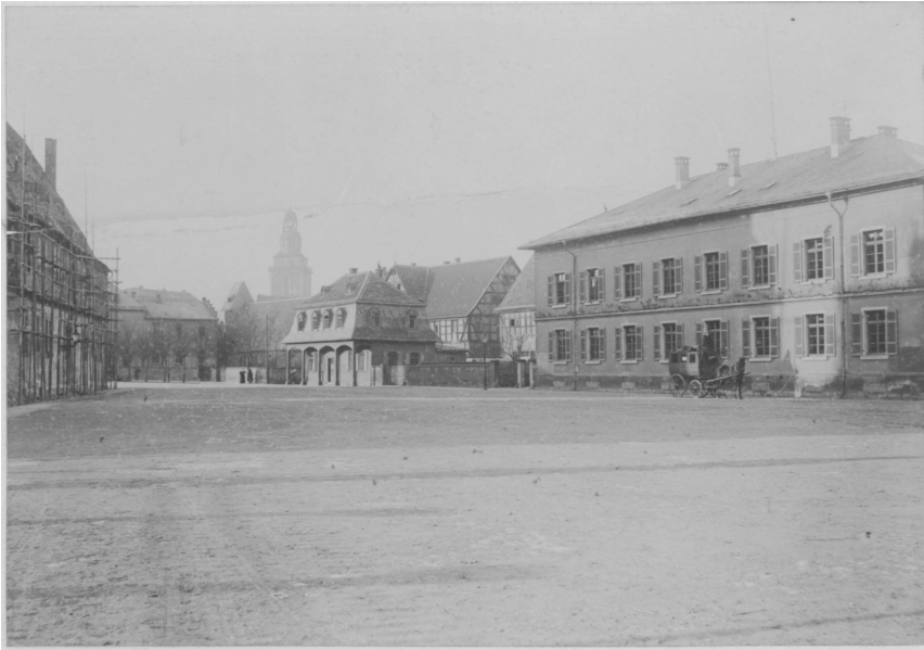
Abb. 1. Fotografie des Brandplatzes mit dem Gebäude der Hauptwache aus dem 18. Jahrhundert. Vor 1900. (StAG Bildersammlung).