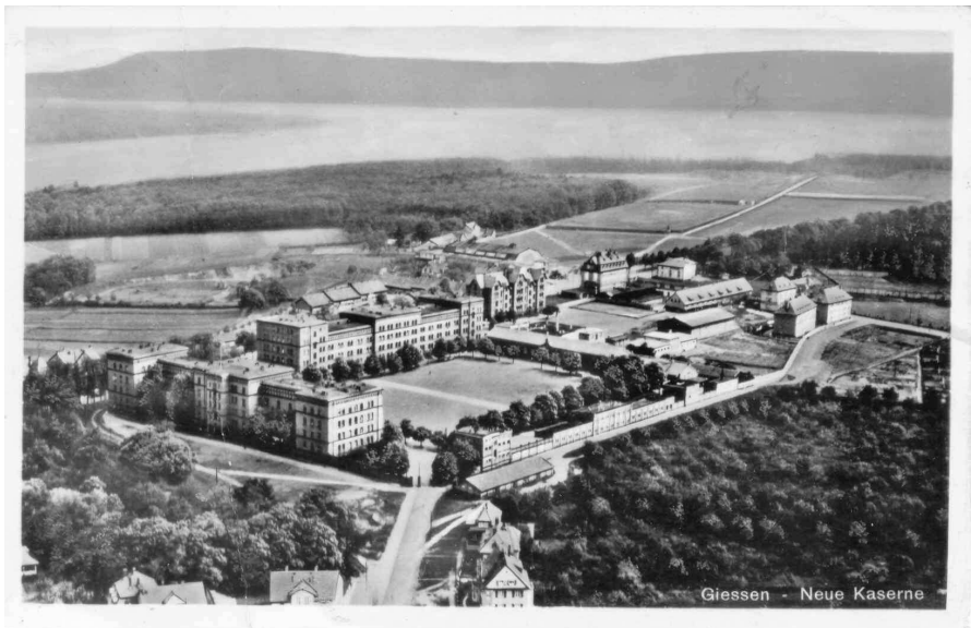
Abb. 4. Luftaufnahme der Neuen Kaserne (später Berg-Kaserne) um 1925.