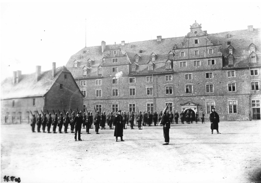
Abb. 2. Exerzierplatz auf der Rückseite der Zeughauskaserne. Aufnahme aus dem Jahr 1903. (StAG Bildersammlung).