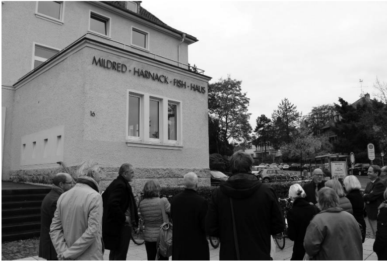
Presstetermin am 25. Okt. 2016 zur Benennung von Mensa und Wohnheim am Leihgesterner Weg in „Mildred-Harnack-Fish-Haus“

Ich begrüße es sehr, dass mit der heutigen Namensgebung künftig auch das „Mildred-Harnack-Fish-Haus“ die Erinnerung an die mutige Absolventin der Universität Gießen wachhalten wird, die ihren Kampf gegen das nationalsozialistische Unrechtsregime mit dem Leben büßte. Mit Mildred Harnack-Fish trägt das Haus nun einen Namen mit Symbolkraft. Ihr mutiges Eintreten für freiheitlich-demokratische Werte in einem Terrorregime von Schrecken und Gewalt ist vorbildhaft, gerade in einer Zeit, in der zunehmende Fremdenfeindlichkeit und rechts-extremistische Übergriffe ein Engagement für eine offene demokratische Gesellschaft notwendiger denn je machen. Sie steht auch für die Internationalität des Universitätslebens und untermauert erinnerungskulturell die langjährige Partnerschaft der JLU mit der Universität Wisconsin – der Heimatuniversität Mildred Harnack-Fishs, wo sie in besonderer Weise in ehrenvoller Erinnerung steht.