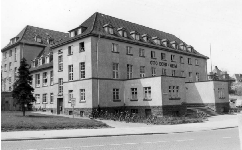
Otto-Eger Heim um 1960

künftig „Kunstgebäude“ heißen soll. Auch in der Stadt Gießen ist gegenwärtig für einige Orte Ähnliches in der Diskussion. In allen diesen Fällen ist ein erinnerungskulturell angemessener Umgang mit der Vergangenheit erforderlich. Ich möchte Ihnen daher nicht nur die neue Namensgeberin dieses Gebäudes – Mildred Harnack-Fish – etwas näher vorstellen, sondern die Gelegenheit auch nutzen, kurz auf den Entscheidungsprozess der Umbenennung und die Gründe dafür einzugehen.