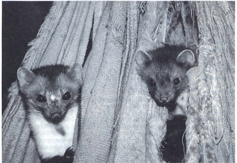
Den größten Teil ihrer aktiven Zeit verbringen die Jungtiere mit Spielen.

Steinmarder in der Jägersprache bezeichnet werden, auf Nahrungssuche ist, verbleibt ihnen genügend Zeit, ihrem Spielbedürfnis nachzugeben. Mit drei bis vier Monaten werden sie dann von der Mutter auf die Nahrungssuche mitgenommen, und lernen so unter ihrer Führung im Laufe der nächsten Monate das gesamte mütterliche Revier kennen. Und wenn die inzwischen ausgewachsenen Jungmarder im Laufe des Herbstes das mütterliche Revier