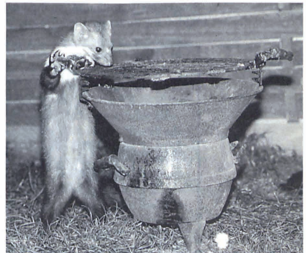
Steinmarder erkunden ihr Revier so sorgfältig, daß sie sich später mit traumwandlerischer Sicherheit zurechtfinden.

auch verständlich, wie sich das Automarderphänomen überhaupt ausbreiten konnte. 1984, als wir mit unseren Untersuchungen zum sogenannten Automarderphänomen anfangen, waren Marderschäden im mittelhessischen Raum noch völlig unbekannt. Die nördli-