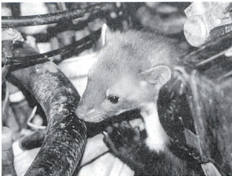
Jeder Autotyp scheint besonders verlockende Stellen für Steinmarder zu haben.

Die Verbreitungsgrenze lag damals etwa auf Höhe des Mains, zwischen Coburg und Frankfurt. Bestätigt wurde diese anhand von Zeitungsmeldungen und Umfragen rekonstruierte Schadensverbreitung auch durch unsere Werkstattuntersuchungen, die wir im Spätsommer 1987 durchführten. Insgesamt besuchten wir mehr als dreißig Werkstätten in verschiedenen Regionen Deutschlands und kontrollierten dort alle PKWs auf Marderspuren. In Stuttgart wiesen damals bereits über dreißig Prozent der Motorräume Marderspuren auf, in Köln und Aachen waren praktisch keine Spuren festzustellen. Ausnahmen bildeten Fahrzeuge, die kurz zu-