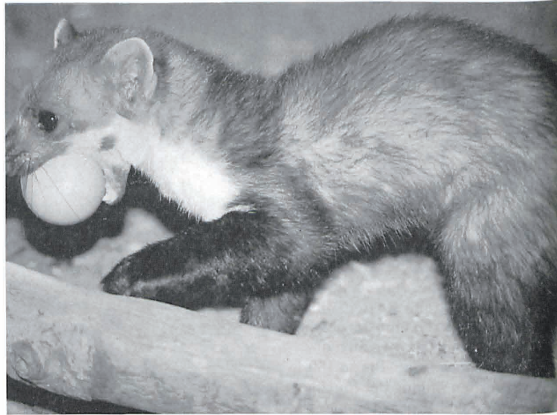
Auch ein zurückgelassenes Ei oder eine Brötchenhälfte können auf einen Steinmarderbesuch hinweisen.

Nachkommen zu ermuntern. In dieser Zeit zeigte Tanja auch eine Verhaltensweise, wie sie zuvor und auch später nie mehr beobachtet werden konnte. Bevor sie das erste Kleine aus der Nestbox