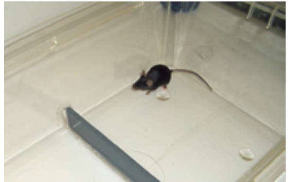
Maus beim Barriere-Test