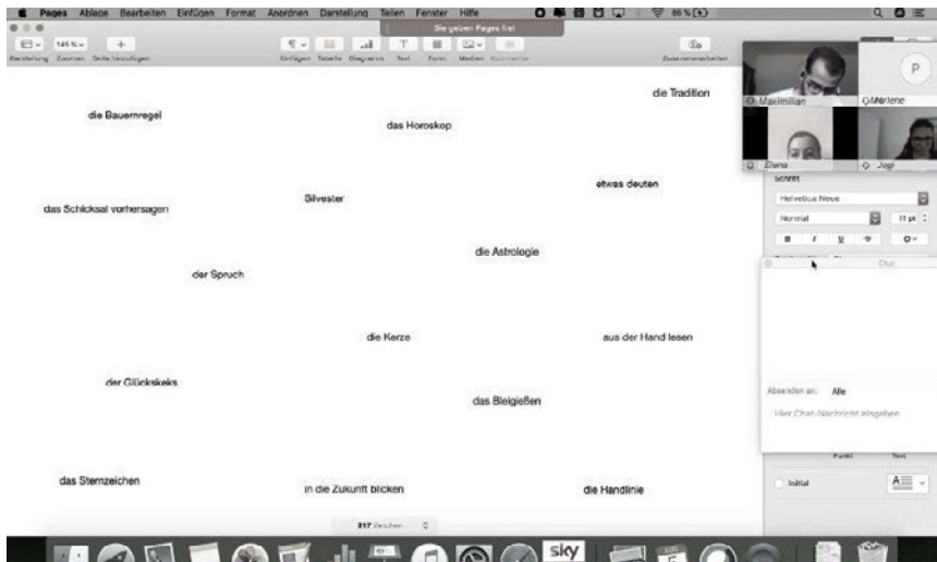
Abb. 1: Ansicht der Lehrkraft bei der Freigabe ihres Bildschirms

Zwei zum gleichen Zeitpunkt aufgenommene, sehr unterschiedliche Bildschirmansichten sind in den Abbildungen 1 und 2 wiedergegeben. Abbildung 1 zeigt den Bildschirm einer Lehrkraft, die ihren Bildschirm mit Vokabeln freigibt, um das Vorwissen der Lernenden zum Unterrichtsthema zu aktivieren. Sie sieht oben rechts vier der elf anwesenden Personen, eine hat ihre Kamera nicht eingeschaltet und ist daher nur als Kachel zu sehen. Die Lehrkraft hat auch das Chatfenster geöffnet, das zu diesem frühen Zeitpunkt im Unterricht allerdings noch leer ist.