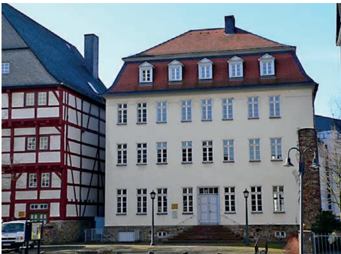
Abb. 1: Das Wallenfels'sche Haus am Kirchenplatz mit der Antikensammlung der Justus-Liebig-Universität Gießen