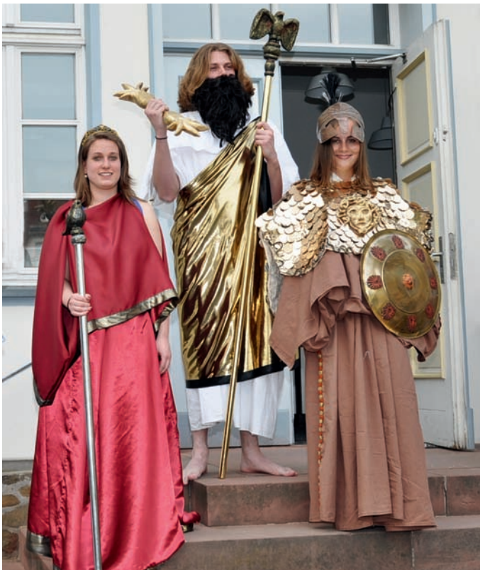
Abb. 4: Ein göttliches Begrüßungskomitee bei der Eröffnung von „Herakles und Co.“ (2010)