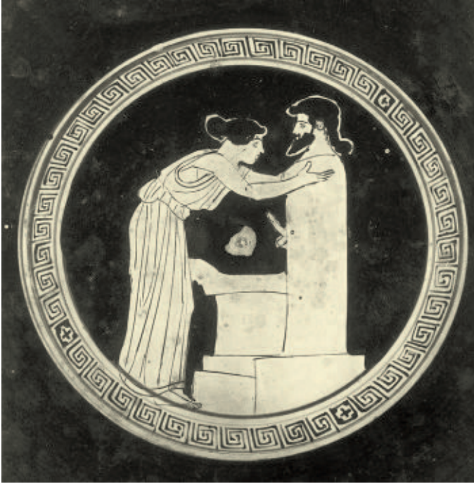
Abb. 4: Attisch rotfigurige Schale des Curtius-Malers, Berlin, Staatliche Museen F 2525

anderes als ein gewaltiges Wertdepot in Göttergestalt". 13 Dies verkennt jedoch die hohe Bedeutung, die Götterbilder nicht nur in Mythos und Ritual, sondern auch ganz konkret für das Wohlergehen der Polis besaßen. Ehe die Stadt unterging, würde als ultima ratio auch die Gottheit ihren Beitrag zur Rettung leisten.