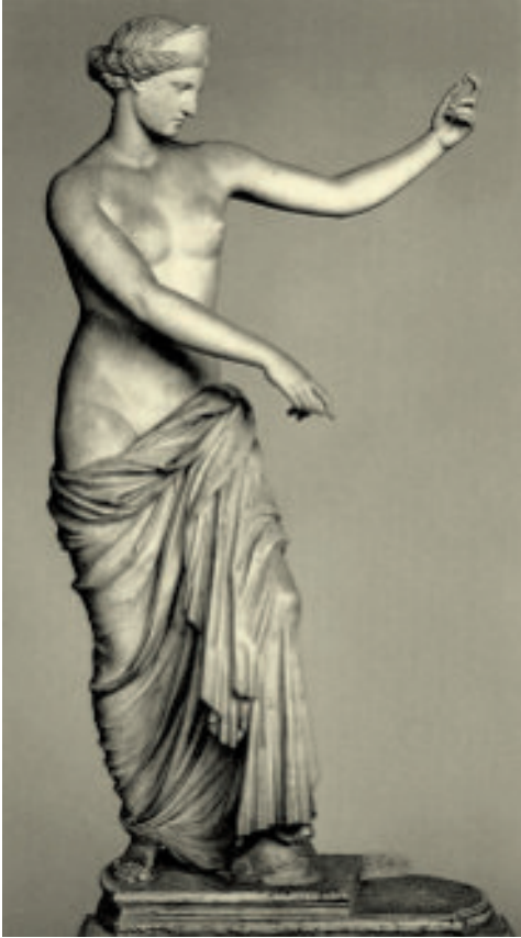
Abb. 2: Aphrodite von Capua, Neapel, NM 6017

aufgehängt, den Gläubigen Gelegenheit gegeben ... , ihren Abscheu vor dem Götzen durch Steinwürfe zu bestätigen“. 2 Die Venusstatue wurde von den Wallfahrern, die St. Matthias besuchten, also in ihr Pilgerritual eingebunden und selbst dann noch mit Steinen beworfen, als von der ursprünglichen Gestaltung der Plastik nichts mehr zu erkennen war. Erst im Jahre 1811, nach Auflösung des Klosters, machte man dem Treiben ein Ende und brachte die Skulptur ins Museum.