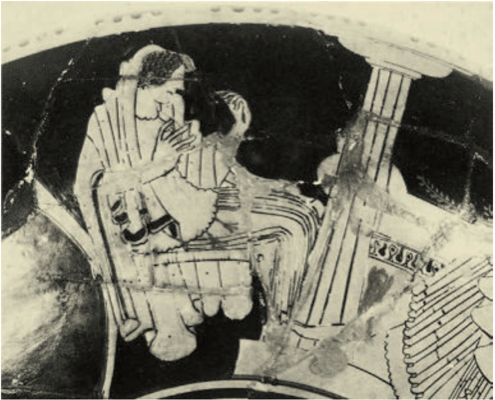
Abb. 6: Attisch rotfigurige Schale des Erzgießerei-Malers, Tarquinia RC 5291

Rituelle Pragmatiken in der oben beschriebenen Art sind recht häufig dargestellt, wie etwa auf einer zwischen 470–460 v. Chr. entstandenen Schale des Curtius-Malers, auf dem eine Frau ein Bild des Hermes umarmt (Abb. 4). 19 Die Versorgung von Götterbildern mit frischem Opferfleisch, das man auf die Hände oder Knie der Statuen legte, zeigt ein Kelchkrater in Ferrara aus dem frühen 4. Jahrhundert v. Chr. 20