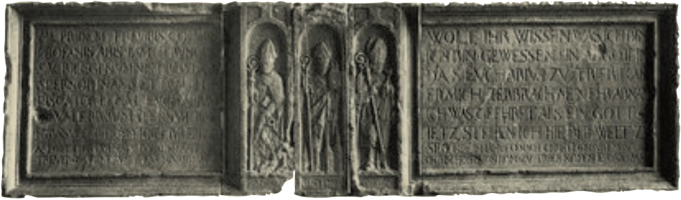
Abb. 3: Inschrifttafel. Trier, St. Matthias

rische Anspruch gesellt sich zu einer tief sitzenden grundsätzlichen Ablehnung heidnischer Götterbilder, die sich bis in die Frühzeit des Christentums zurückverfolgen lässt und die in dem angesprochenen Spannungsverhältnis zwischen Ontologie und Phänomenologie von Götterbildern gründet. Exemplarisch für Vorbehalte gegen Götterbilder sei hier eine Passage aus dem „Octavius“ des Minucius Felix in Übersetzung angeführt. Der wohl aus Nordafrika stammende Autor lebte als Anwalt im 2./3. Jahrhundert n. Chr. in Rom. Nach seiner Konversion schrieb er einen Dialog zwischen Caecilius und dem Christen Octavius, der mit der Bekehrung des ersteren endet. In diesem Zusammenhang lässt der Autor seinen Protagonisten Octavius sagen: