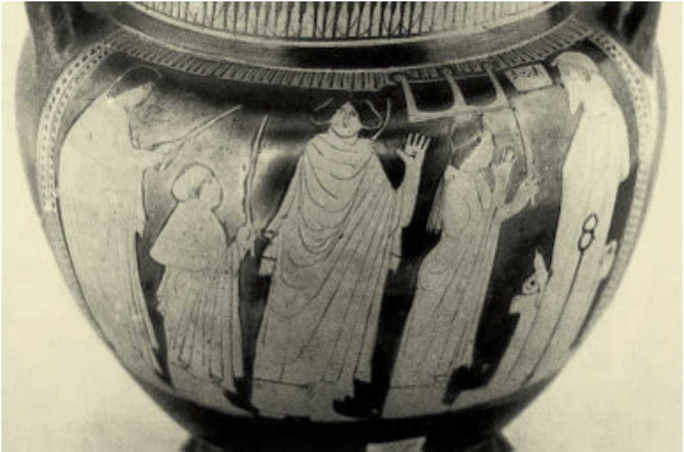
Abb. 7: Attisch rotfiguriger Kolonettenkrater des Obstgarten-Malers, Neapel, NM H 3369

ebenen werden hier überblendet, wodurch das Bezeichnende und das Bezeichnete absichtsvoll zur Koaleszenz gebracht werden.