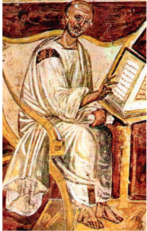
Abb. 2: Augustinus, Mosaik aus der Kapelle Sancta Sanctorum in der Bibliothek Gregors des Großen im Lateranpalast in Rom, 6. Jh.

Fassen wir zusammen: Eine der Grundannahmen der Forschung lautet also, dass der Episkopat in der Spätantike eine Transformation vollzogen hat, welche entweder in ihrer rechtlichen bzw. sozialen Dimension beschrieben oder auf dem Hintergrund veränderter religiöser Bedürfnisse interpretiert wird. Dabei wird speziell der Phase des Übergangs vom Prinzipat zur Spätantike entscheidende Bedeutung beigemessen. Auffällig ist, dass sich die Mehrzahl der Studien auf jeweils eine der beiden Epochen konzentriert, ohne die andere näher zu beleuchten. Weiterhin ist zu beobachten, dass in der Beschäftigung mit den Bischöfen der Fokus zumeist auf der Handlungsebene liegt, ohne dass die Ebene der zeitgenössischen Reflexion einbezogen wird: Gefragt wird nach den Aktionsfeldern und Kompetenzen der Bischöfe innerhalb wie außerhalb ihrer Gemeinden, wobei diese in der Regel nach modernen Kategorien definiert werden. Wie oben schon bemerkt, kann sich das darin äußern, dass man zwischen profan und sakral scheidet oder auch eine klare Trennung von Kirchen- und Stadtgemeinde insinuiert. Auf