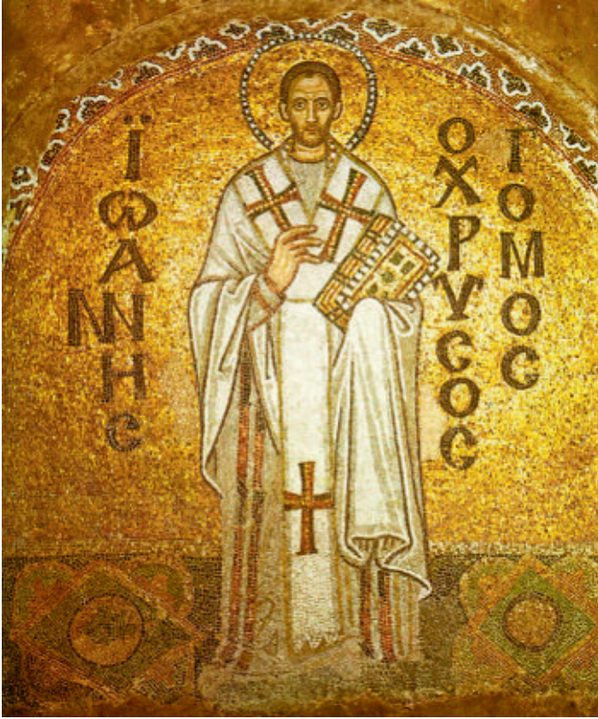
Abb. 3: Johannes Chrysostomos, Mosaik aus der Hagia Sophia in Istanbul, 9. Jh.