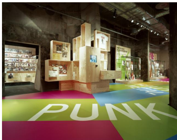
Abbildung 1: Blick in die Ausstellung

In diesem Artikel sollen Fragen zum Zusammenwirken der Institution Museum mit dem Ausstellungsgegenstand Popmusik erörtert werden. Ziel ist dabei nicht, die Ausstellung Rock und Pop im Pott in Gänze darzustellen bzw. zu analysieren. Stattdessen werden im Folgenden zuerst Rolle und Charakter der Institution Museum umrissen. Anschließend werden Aspekte des Feldes populärer Musik erörtert, die Relevanz für deren Musealisierung aufweisen: Prozesse von Kanonisierung, das von Simon Reynolds (2012) »Retromania« getaufte Phänomen, die Tendenzen zu »musical gentrification« und »cultural omnivorousness«, die Petter Dyndahl et al. (2014) ausmachen, sowie Sub- und Jugendkulturen im Spannungsfeld von Globalem und Lokalem. An konkreten Beispielen aus Ausstellungen zu populärer Musik, besonders jener im Ruhr Museum, wird dabei diskutiert, wie diese verschiedenen Faktoren zusammenwirken – nicht zuletzt aus der Perspektive von Bildung und Vermittlung.