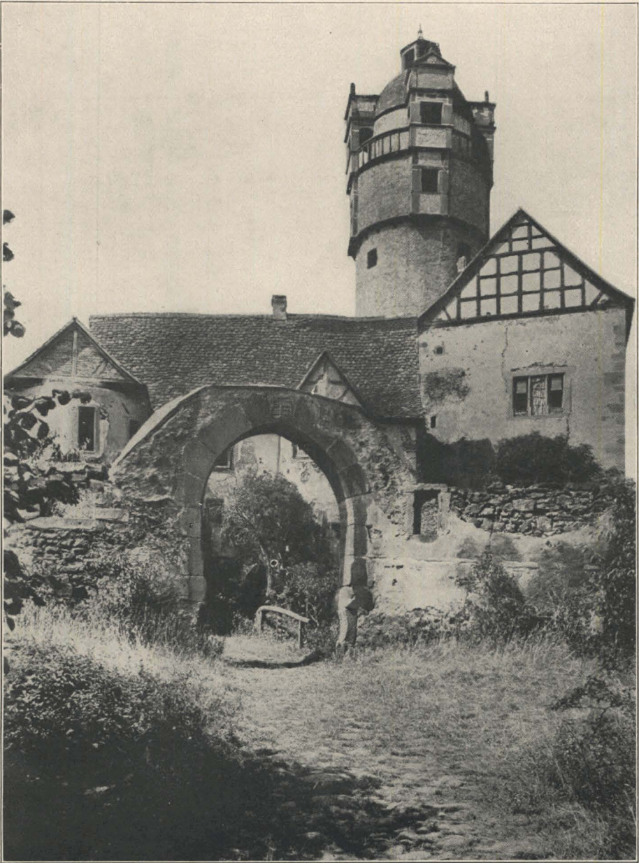
Die Konneburg. Ausgang zum Vorwerk.