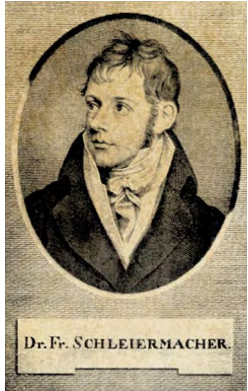
Friedrich Schleiermacher, Kupferstich von Johann Heinrich Lips.

Für die von der akademischen Theologie strikt zu unterscheidende kirchliche Institution heißt das, dass sie wieder mehr Theologie wagen muss, um in der pluralistischen Gesellschaft erkennbar zu sein und mit Rede von Gott, Mensch und Welt plausible Sinndeutungsangebote zu unterbreiten, die vor der modernen Rationalität bestehen können. Denn es gilt ein Wechselverhältnis: Das aufgeklärte Christentum, der aufgeklärte Protestantismus braucht eine starke kirchliche Institution. Und die Institution Kirche braucht den Aufklärungsimpuls der modernen Theologie. Warum ist das so? Grundlegend darum, damit der „Knoten der Geschichte“ zwischen Wissenschaft und Christentum nicht auseinandergeht – und die Gottesfrage nicht unreflektiert religiösen Funktionen überlassen wird. 22 Bereits der Theologe, Philosoph, Pädagoge und Platon-Übersetzer