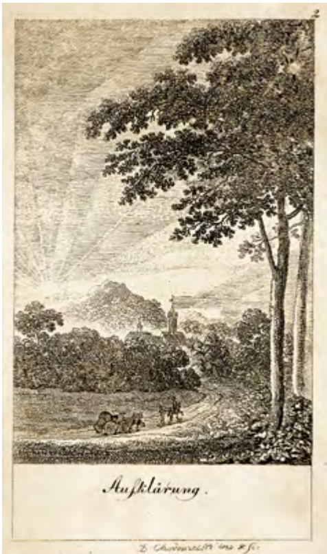
Allegorisches Blatt zum „Zeitalter der Aufklärung“ von Daniel Nikolaus Chodowiecki, Göttingen, 1791.