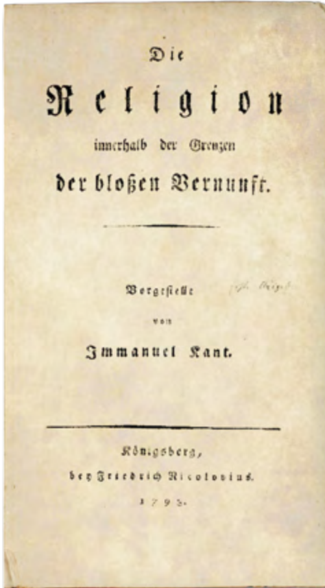
Titelblatt I. Kant: Die Religion innerhalb der bloßen Vernunft, Königsberg 1785.

und Bösem zum Trotz als eine Entwicklung, als ein Fortschritt, hin zum Guten zu erkennen. Theologisch gesprochen ist sie „eine voranschreitende Durchsetzung göttlicher Gegenwart in der Vielfalt individueller Realisierungsformen“. 34 Im Aufzeigen dieses „Lichtes christlicher Aufklärung“ 35 für die Welt liegt die bleibende Kraft des aufgeklärten Protestantismus, auch als religiöse Minderheit eine Kraftquelle für die Freiheitsbildung des Einzelnen und des Gemeinsinnes zu sein.