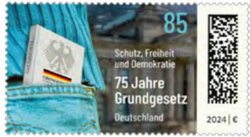
Briefmarke 75 Jahre Grundgesetz.

In Zeiten rasant zunehmender Gottlosigkeit und Gottvergessenheit ist es erstens bleibend wichtig, daran zu erinnern, dass der Mensch fehlbar ist und es etwas Höheres als den Menschen gibt. 24 In der Präambel des Grundgesetzes wird vom „Bewusstsein der Verantwortung vor Gott und den Menschen“ gesprochen. Mit dem Bezug auf Gott ist auf eine für den Menschen unverfügbare Instanz verwiesen ( nominatio dei ), vor der er Verantwortung tragen und Rechenschaft ablegen muss. So wird die