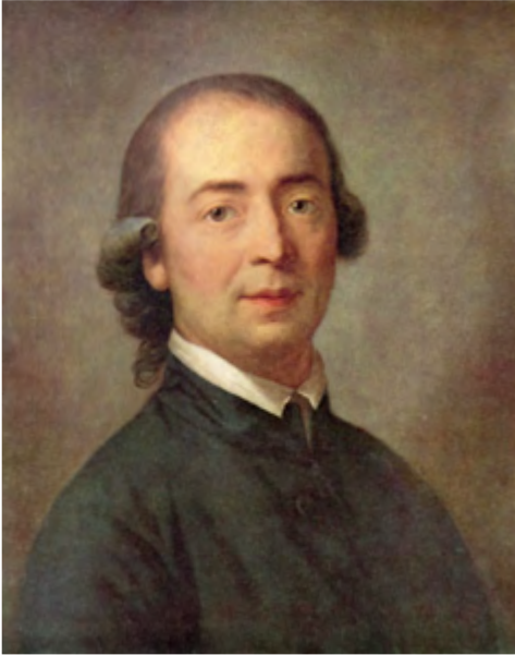
Johann Gottfried Herder, Gemälde von Anton Graff, 1785, Gleimhaus Museum der deutschen Aufklärung, Halberstadt.