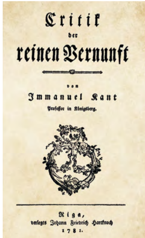
Titelblatt I. Kant: Kritik der reinen Vernunft, Riga 1781

Für die evangelische Theologie bedeutet das, dass sie die Gottesfrage verstärkt in den Fokus