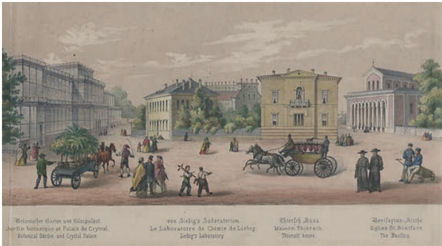
Abb. 5: Wohnbaus von Justus Liebig in München, rechts dahinter der Neubau des chemischen Laboratoriums (Lithografie 1864, Privatbesitz).

neubau, der zu jener Zeit der am besten ausgestattete in Deutschland gewesen sein dürfte. Er enthielt im Zentrum den sogenannten Liebigschen Hörsaal, der bis zu 300 Personen aufnehmen konnte. Hier fanden Liebigs vielbeachtete Vorlesungen und die von ihm initiierten Abendvorträge statt, mit denen ein breites bürgerliches Publikum – darunter auch Damen – mit der Welt der Chemie bekannt gemacht wurde.