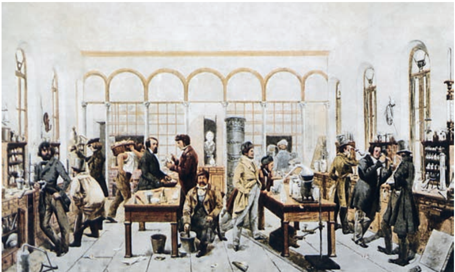
Abb. 3: Innenansicht des chemischen Laboratoriums nach der Zeichnung von Trautschold und v. Ritgen, um 1840.