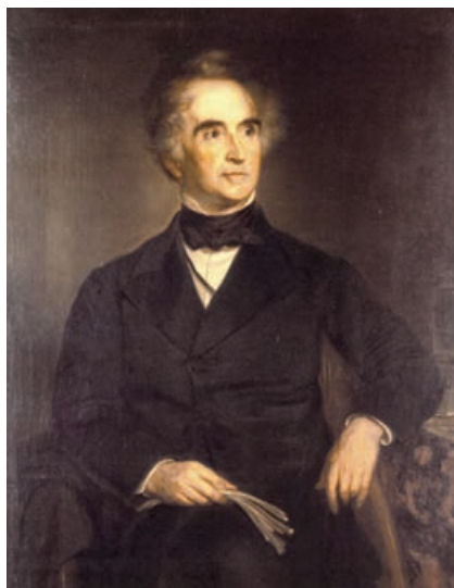
Abb. 1: Porträt Justus Liebig's von Wilhelm Trautschold 1842 (Fotografie nach einem Gemälde. Original im Besitz der Justus-Liebig-Universität Gießen).

Als Liebig am 18. April 1873 im Alter von knapp 70 Jahren an seinem letzten Wirkungsort München verstarb, war er auf dem Gipfel seiner Karriere angelangt. Seine bahnbrechenden Forschungen auf dem Gebiet der organischen Chemie hatten ihm im In- und Ausland ein enormes Renommée verschafft und sein Fach – die Chemie –, die bis zum Ende des 18. Jahrhunderts nicht mehr als eine Hilfswissenschaft der Medizin gewesen war, hatte sich einen festen Platz im Lehrplan der Universitäten erobert. Aber Liebig war nicht nur ein herausragender Chemiker, er war vielmehr als das. Er war ein überaus streitbarer Zeitgenosse, der seine Ideen rigoros bis hin zu offener Polemik gegenüber Andersdenkenden verfocht und der die damaligen Mittel der Publizistik virtuos für die Durchsetzung seiner Ansichten und zur Vermarktung seines Namens nutzte. Wenn er sich für seine Person