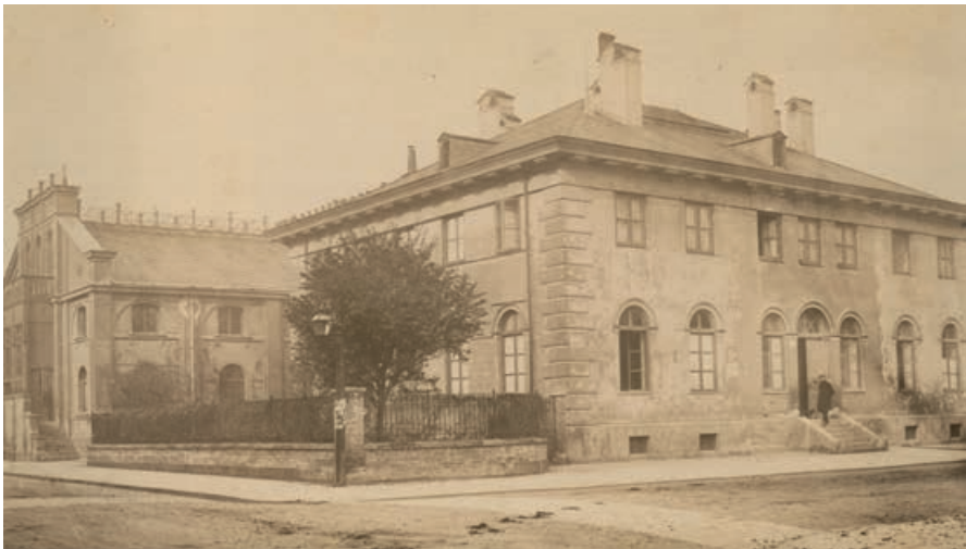
Abb. 6: Ansicht des Wohnhauses von Justus Liebig in München, links daneben das chemische Laboratorium, undatiert (Fotografie, Universitätsarchiv Gießen, Liebig-Depositum Nr. 473).