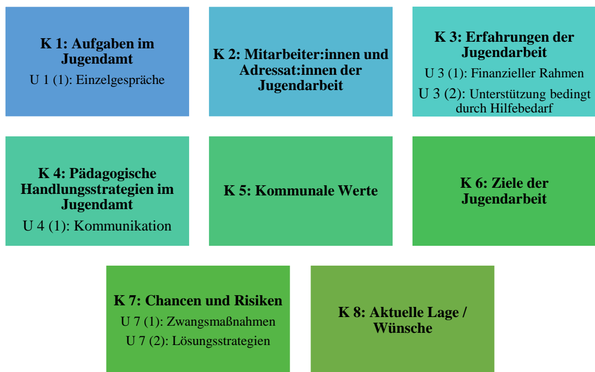
Abbildung 6: Kategoriensystem: Interview 2

In Relation zum ersten Interview können die Kategoriethemen numerisch unterschiedlich geordnet sein, da die Kategoriererstellung nach chronologischer Abfolge des Interviewverlaufes erfolgt ist. Exemplarisch sind im ersten Interview die Aufgaben in der Kirche in der Kategorie 2 eingeordnet, wohingegen im zweiten Interview die Aufgaben im Jugendamt in der Kategorie 1 zu finden sind.