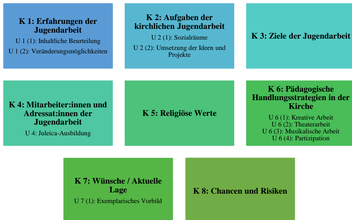
Abbildung 5: Kategoriensystem: Interview 1

Zum Einstieg wird zunächst eine Abbildung dargestellt, in der die erzielten Kategorien des ersten Interviews aufgezeigt werden. Für das erste Interview wurden in Anbetracht der vier genannten Themenschwerpunkte insgesamt acht Hauptkategorien und zehn Unterkategorien erstellt. Dabei sind die Hauptkategorien keineswegs einander über- oder untergeordnet. Die Aufgliederung ist nach chronologischer Abfolge des Interviewverlaufes entstanden.