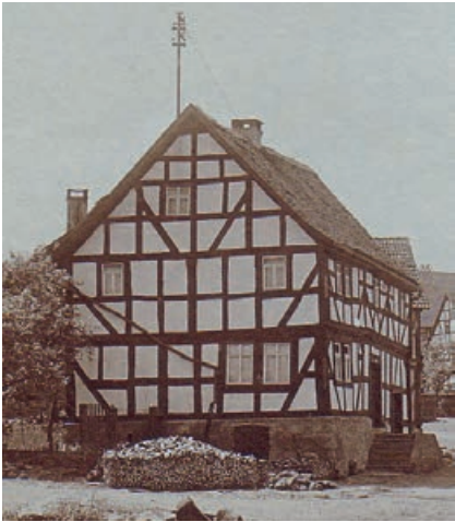
Abb. 26: Das frühere Fachwerkwohnhaus der Angenröder Familie Steinberger im Dorfzentrum an der „Breiten Bach“.

Steinberger, entsprach die Entschädigungsbehörde des Regierungspräsidiums Darmstadt mit Festsetzungsbescheid vom 14.06.1956.