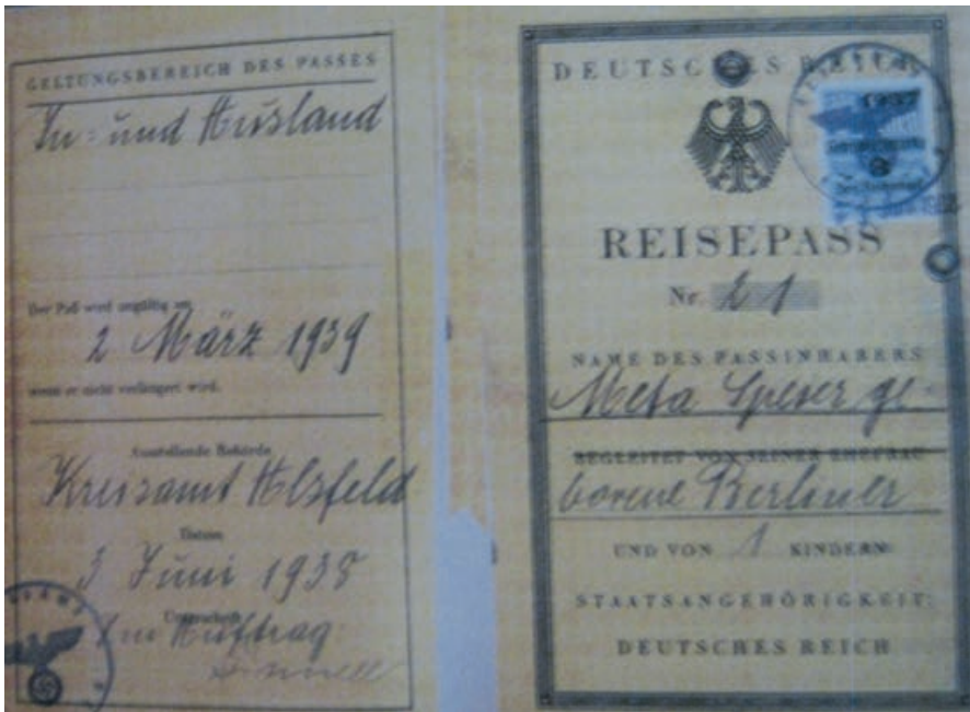
Abb. 19: Reisepass der Ehefrau Hugo Speiers, Meta Speier, bezüglich Auswanderung in die USA.