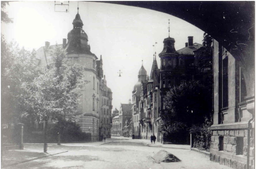
Abb. 1: Landgrafenstraße 1, Quelle: Stadtarchiv Gießen

Die Enteignung von Juden und die Vertreibung aus ihren Wohnungen während des Nationalsozialismus in Gießen