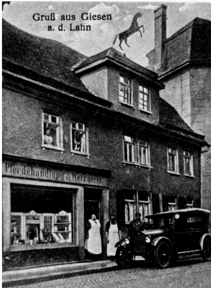
Abb. 3: Metzgerei der Kesslers im Neuenweg 33, Quelle: Dr. Werner Schmidt