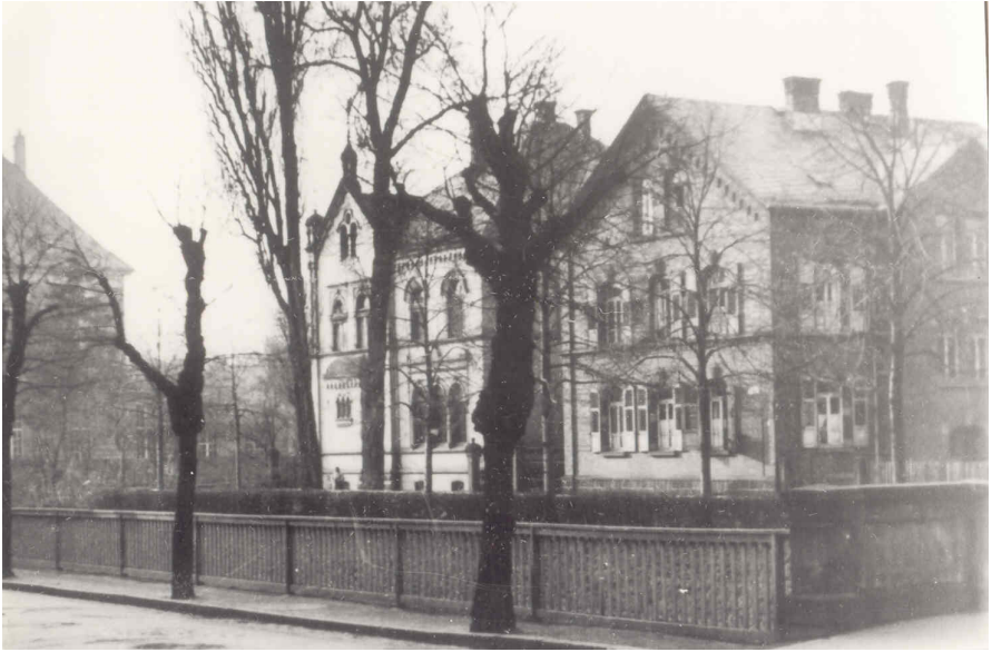
Abb. 2: Lonystraße 4 (MiAe)

te außerdem an, dass sie aufgrund der Krankheit ihres Mannes eine abgeschlossene Wohnung benötigten. 101