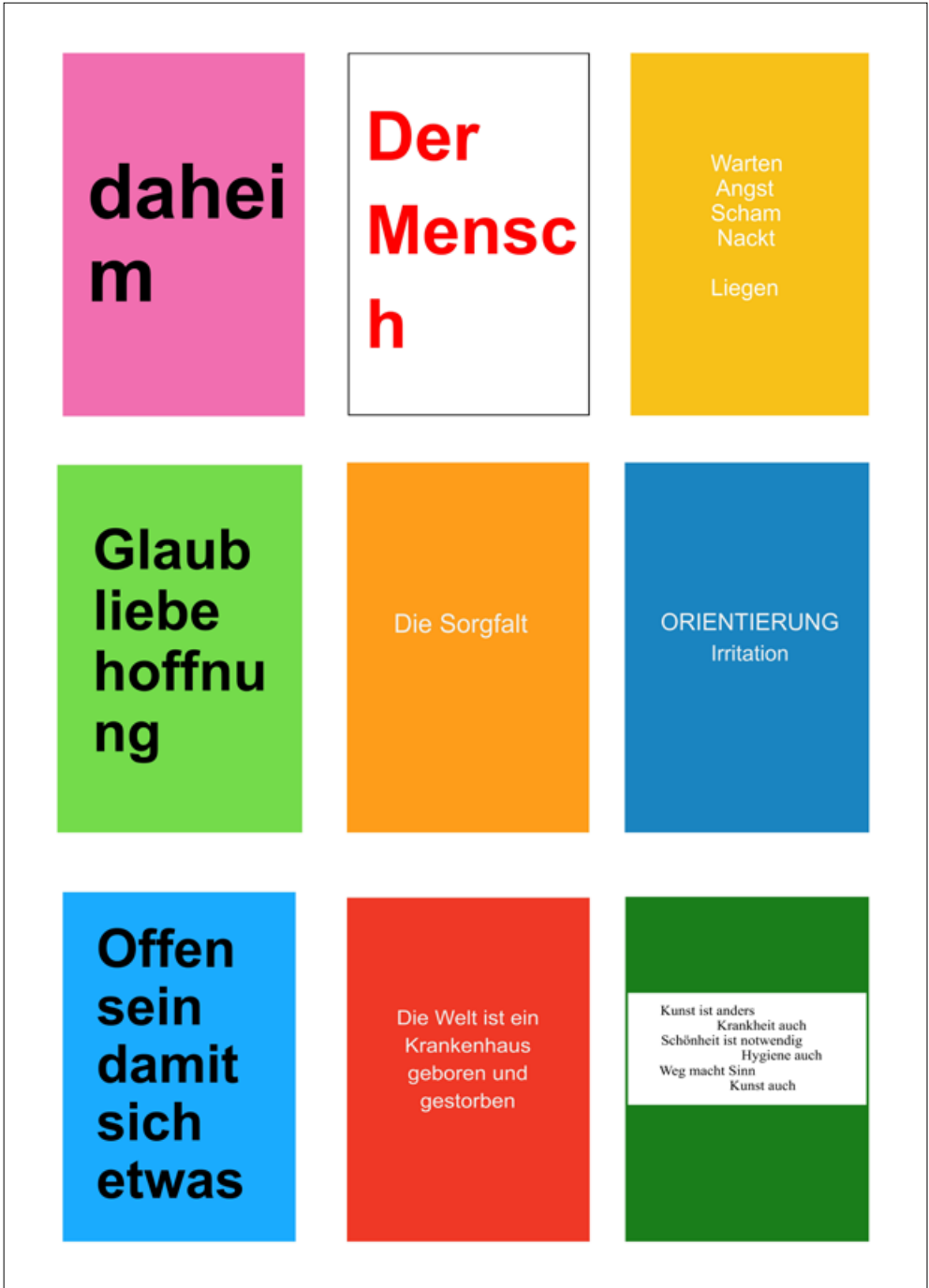
Spotlights, Poster: Ausstellung „Was macht die Kunst im Uniklinikum?“ (2019). Große Magistrale Ebene 0.