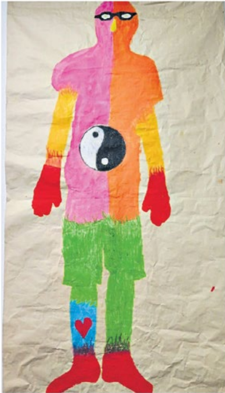
Geradezu überwältigend sind die großformatigen, lebensgroßen Darstellungen des eigenen Körpers.