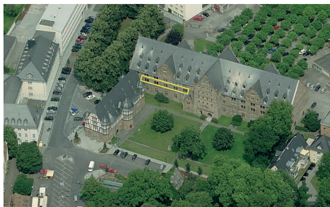
Das Zeughaus: Unser neuer Standort seit Oktober 08