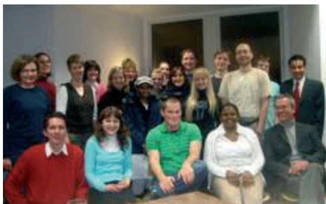
ZEU-Team & Transition Studies-Studis, Dezember 08