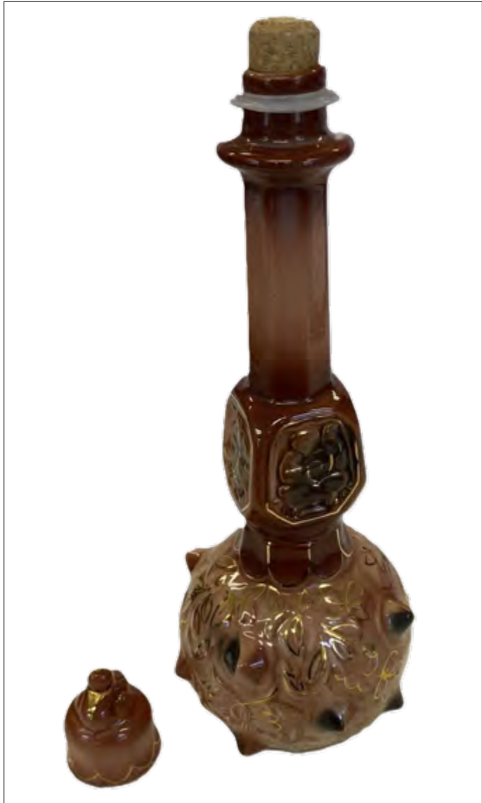
Abb. 6: Likörfflasche in Form einer Bulawa, Inv.-Nr.: UAG, Sammlung Gastgeschenke, Nr. 110, Justus-Liebig-Universität Gießen.

und Bulawa sind zwei Symbole, die bei der Kontinuitätstheorie und dem Verweis auf Erbe und Traditionen eine prägende Rolle spielen. Beide Symbole werden häufig miteinander verbunden, wie etwa bei der Einführung in das Amt des Präsidenten, wo der Trysub im Wappen der Ukraine auf der Amtskette des