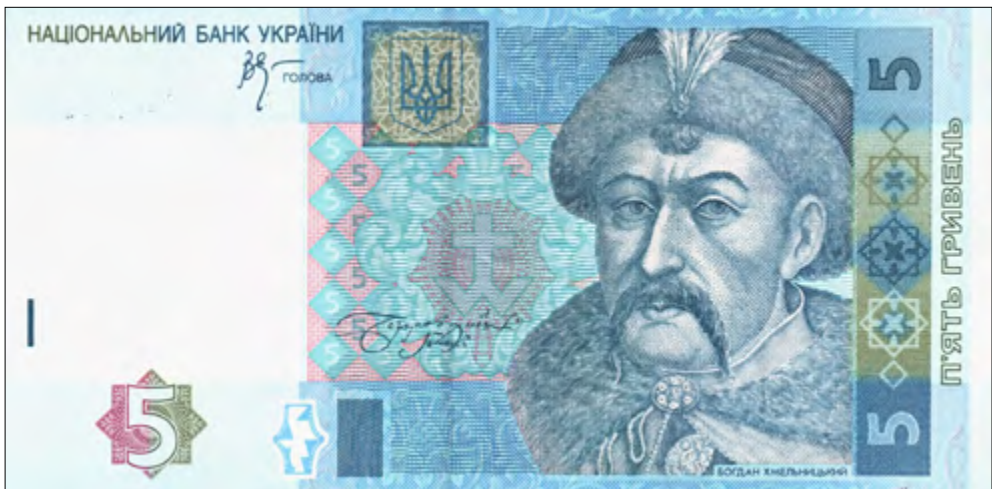
Abb. 4: Bohdan Chmel'nyč'kyj auf dem Fünf-Hryvnja-Schein. Mittig oben ist der Tryzub (Dreizack) im Wappen der Ukraine zu sehen. National Bank of Ukraine: 5 hryvnia 2005 front.

Dieser Unterdrückung kämpferisch begegnend, wengleich mit pessimistischem Beiklang, zeigt sich die Ukraine in Erinnerung an die Abschaffung des Hetmanats, wenn ihre Nationalhymne „Noch ist die Ukraine nicht