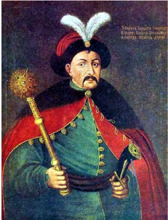
Abb. 3: Kopie eines Porträts des Hetmans der Zaporoger Kosaken und des Kosaken-Hetmanats Bohdan Chmel’nyč’kij mit Bulawa aus dem 19. Jahrhundert. Bohdan Chmelnyzkyj, Staatliches Historisches Museum (Moskau).

Weitgehend frei konnten die Kosaken dort Siedlungen und Festungsanlagen errichten, nach deren Ort – „hinter den Stromschnellen“ ( za porohami ) des Dnipro – sie als Zaporoger Kosaken bezeichnet wurden. 11 Sie dienten als Grenzwächter und Söldner, unternahmen Raubzüge, gingen auf Jagd und Fischfang und traten durch Aufstände gegen Polen in Erscheinung. 12 In ihren Festungsanlagen – besonders der Zaporoger Sič – könnte ein Wendepunkt im Bewusstsein der Kosaken gesehen werden, die damit einen unabhängigen Mittelpunkt und Rückzugsort besaßen. 13 Zudem bildeten sich eine eigene Rechtsprechung und Obrigkeit, wobei die Re-