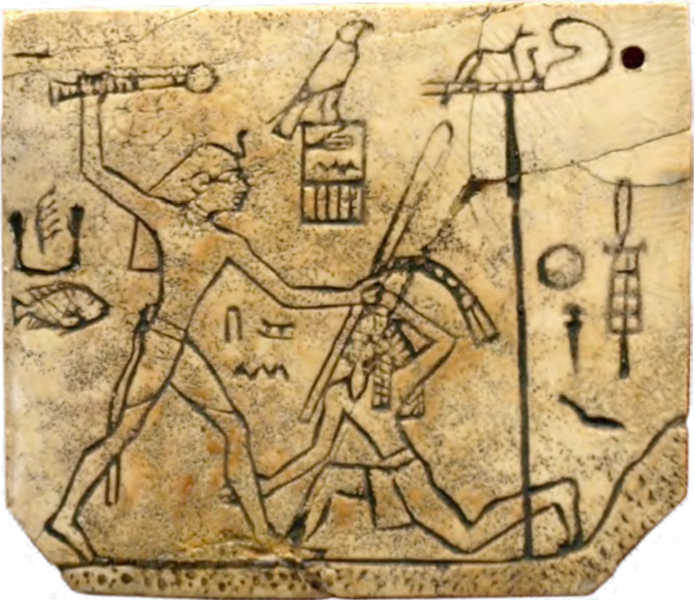
Abb. 1: Die MacGregor-Plakette zeigt den ägyptischen König Den, wie er mit einer Keule bzw. einem Prunkzepter zum tödlichen Schlag gegen seinen Feind ausholt. Das Objekt stammt aus der frühdynastischen Periode, 1. Dynastie, um 3000 v. Chr. Maße: Höhe: 4,50 cm, Breite: 5,30 cm, Tiefe: 0,30 cm, Gewicht: 10 g. Es befindet sich im British Museum (EA 55586). https://t1p.de/2x2u5 (zuletzt abgerufen: 28.02.2025,)

Repertoire des ritterlichen Kampfes aufgenommen, [...] ihre militärische Effektivität führte [...] zu ihrer Akzeptanz“. 9 Die „Aufwertung“ des Streitkolbens war jedoch damit nicht zu Ende. Er wurde zu einem Symbol der Macht, aus dem sich wahrscheinlich Zepfer und ähnliche Statussymbole entwickelten.