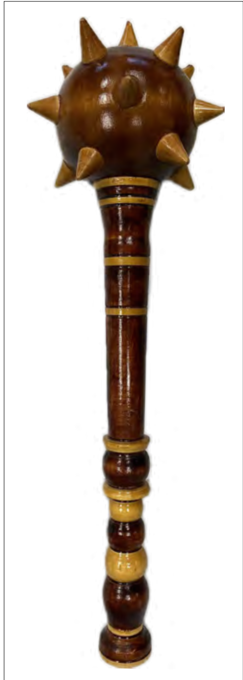
Abb. 2: Hölzerne Bulawa (Streitkolben/Amtsstab), Inv.-Nr.: UAG, Sammlung Gastgeschenke, Nr. 26, Justus-Liebig-Universität Gießen.

Während die Mongolen im 13. Jahrhundert die Kyjiwer Rus erobert hatten, die westlichen Gebiete im 14. Jahrhundert an Polen und Litauen und die nördlichen und nordöstlichen Teile im Laufe des 16. Jahrhunderts an