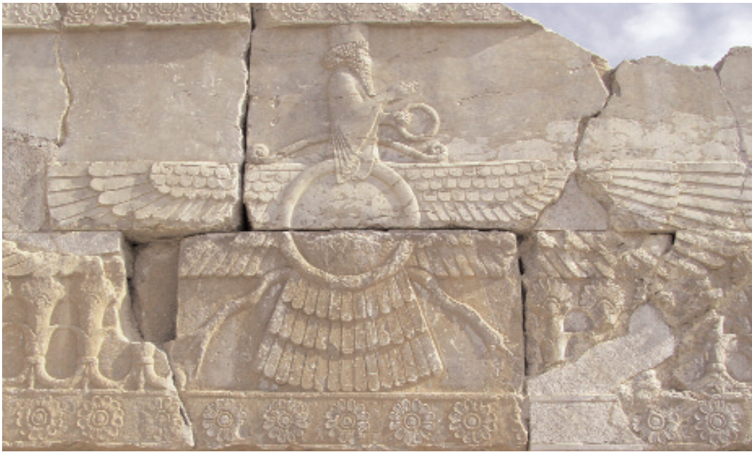
Die geflügelte Sonnenscheibe mit einer männlichen, bärtigen Figur darin, vermutlich Symbol des zarathustrischen Gottes Ahura Mazda.

bekennen zu müssen, lässt erkennen, dass etwas Neues auf dem Boden der Religionsgeschichte entstanden ist, die Umpolung der Judäer auf eine echte Glaubensgemeinschaft.