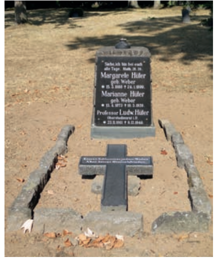
Abb. 10: Renovierte Grabstätte – Vorderseite (August 2022), Foto: Dagmar Klein.

ein Vorbote des Leidens, dem er am 9. Dezember 1940 im Evangelischen Schwesternhaus erlag: Die Todesursache war laut Sterberegistereintrag Vorsteherdrüsenkrebs (in Verbindung mit Kreislaufschwäche). 135 Mit dem Tod von Ehefrau Marianne (19. März 1939) hatte Hüter zuvor einen letzten Schicksalsschlag auszuhalten gehabt. 136 Hüters Grab und das seiner Familie befindet sich auf dem Gießener Alten Friedhof. Nachdem der Stein und die Umfassung zuvor schon fast im Erdreich versunken waren, wurde die Grabstätte 2022 wieder instandgesetzt und angelegt. 137