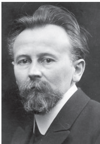
Abb. 3: Eduard David (1863–1930).

für die politische Betätigung gilt, trifft auch auf Hüters Verhältnis zu Parteigrößen wie Eduard David und Wilhelm Liebknecht zu: Es bleibt für die Zeit des Wilhelminismus weitgehend im Dunkeln. Das kann sich ändern, wenn weitere Hüter-Korrespondenzen oder andere Quellen „entdeckt“ werden und Abhilfe schaffen. Bis dahin stützt sich die Analyse freilich notgedrungen auf Indizien.