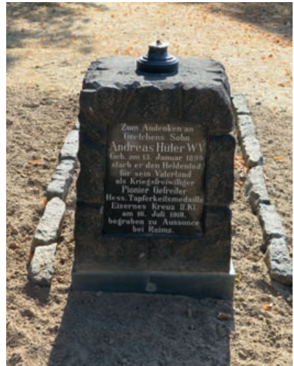
Abb. 11: Renovierte Grabstätte – Rückseite (August 2022), Foto: Dagmar Klein.