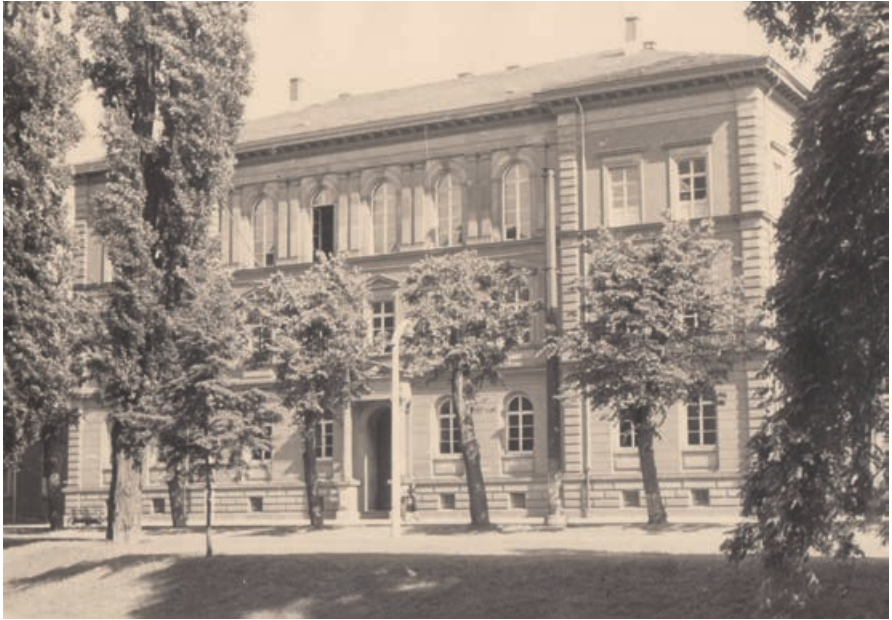
Abb. 2: Großherzogliches Gymnasium (ab 1907: Landgraf-Ludwigs-Gymnasium) in der Südanlage, Landgraf-Ludwigs-Gymnasium – Fotoarchiv.

zu Ende“. 14 Mit seiner Bestürzung stellte der Gießener OStR wohl einen ‚zivilen‘ Gegenentwurf zu jenem Typus dar, den Erich Maria Remarque im Roman „Im Westen nichts Neues“ vorgestellt hatte: Der Lehrer Kantorek weckte bei seinen Schülern mit patriotischen Worten aus Überzeugung und Bedacht den Wunsch, sich freiwillig für den Kriegsdienst zu melden.