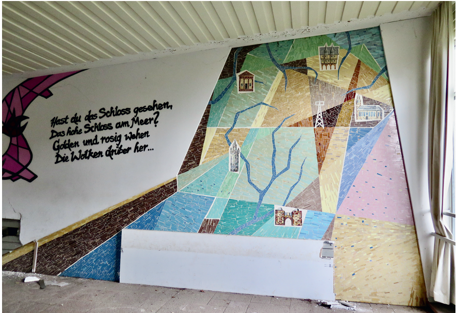
Abb. 6.1: Das Kröll'sche Wandmosaik in der Pausenhalle der Ludwig-Ubland-Schule (LUS) mit markanten historischen Gebäuden in Hessen, März 2022.