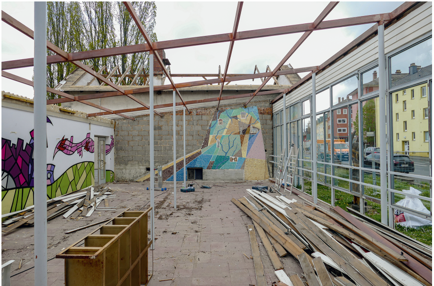
Abb. 6.2: Das Kröll'sche Wandmosaik in der LUS-Pausenhalle während des Abtrags im Juli 2022.