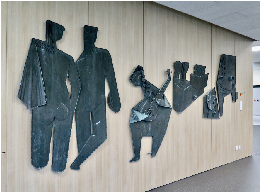
Abb. 8: Das Pohlheimer Wandrelief an seinem neuen Ort im Foyer des Limes-Schulneubaus, April 2024.

Zurück zum Anfang: das große Metallrelief von Kröll wurde in den Pohlheim'schen Schulneubau übernommen, hängt jetzt an einer Wand im großzügigen Eingangsbereich. Im Frühjahr 2024 wurde es der Öffentlichkeit vorgestellt. 11