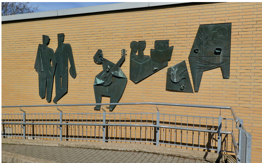
Abb. 1: Wandrelief an der Limes-Schule Pohlheim, März 2021.