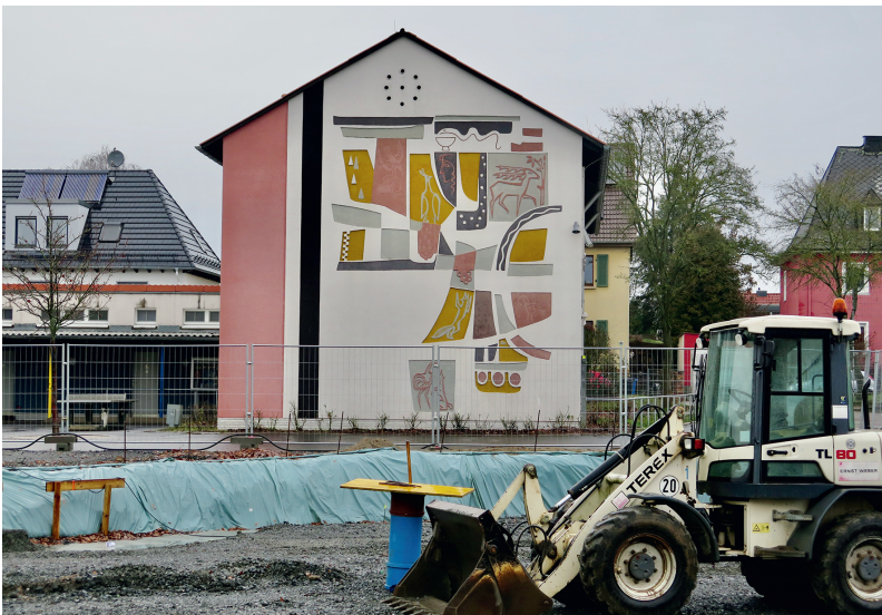
Abb. 5: Das Sgraffito an der Giebelwand der LUS mit Motiven der Fabeln von Aesop, Foto in der Zeit des Neubaus Januar 2023.