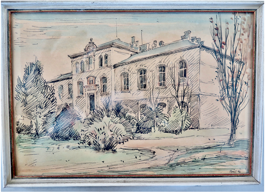
Abb. 10: Die gezeichnete Ansicht des einstigen Hygiene-Instituts ist mit 1946 datiert. Kröll fertigte sie demzufolge nachdem das Gebäude im Zweiten Weltkrieg zerstört worden war. Das Dekanat übergab die Zeichnung 2022 dem Universitätsarchiv.

1954 bei der Post, lebte in der Zeit in der ländlichen Ruhe von Kloster Arnburg, bevor er 1965 nach Gießen zurückzog. Er gab Kurse als Kunsterzieher in der Jugendstrafanstalt Rockenberg und an der Volkshochschule Gießen.