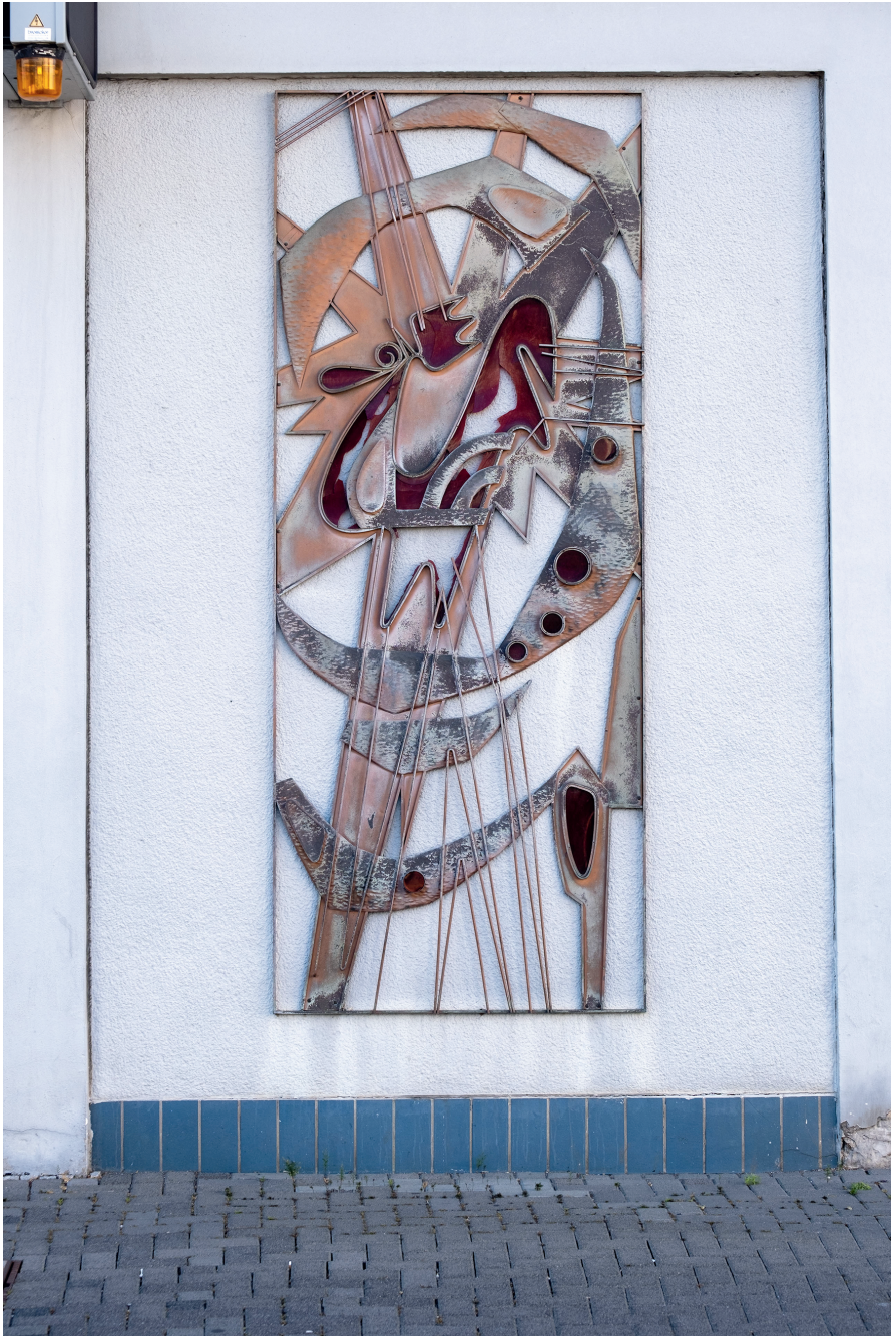
Abb. 3.1: Der Hahn an der Feuerwache 2022.