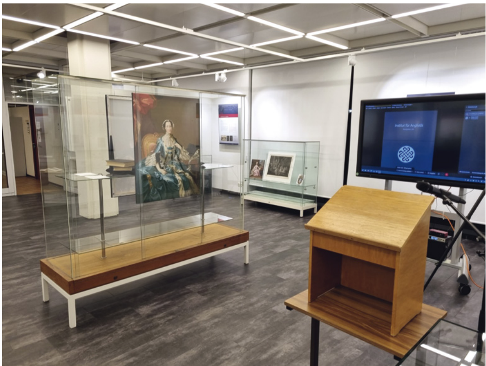
Abb. 3: Blick in den Ausstellungsraum der Gießener Universitätsbibliothek mit dem Aufbau für die digitale Eröffnung am 13. Januar 2022.