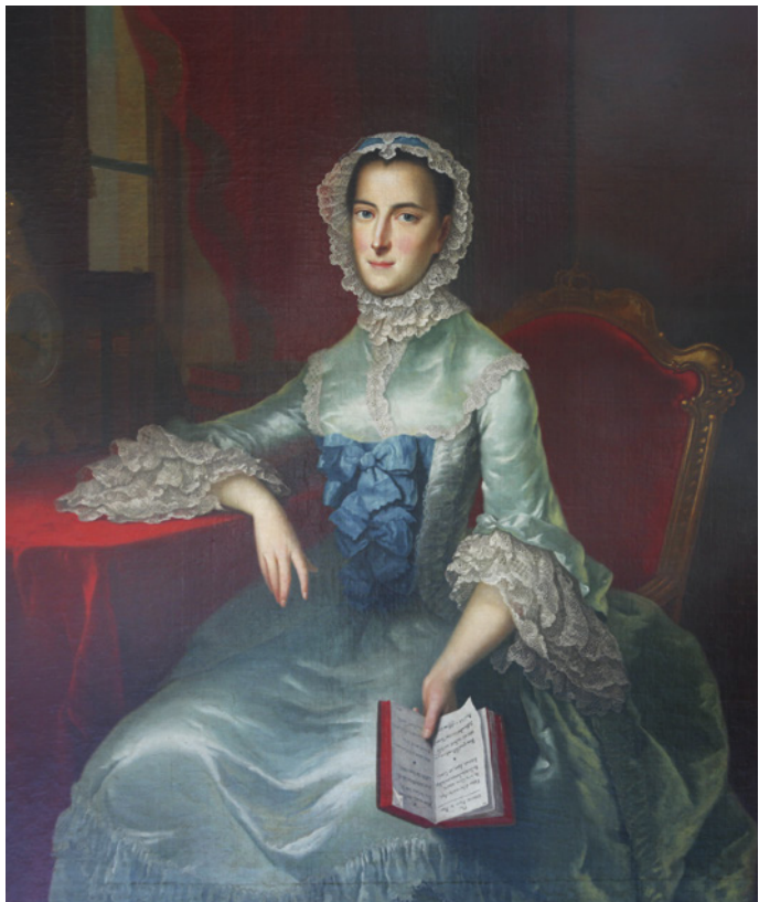
Abb. 1: Prinzessin Marie von Hessen-Kassel, Johann Heinrich Tischbein d.Ä. (Werkstatt), Öl auf Leinwand, um 1755.

engen historischen und kulturellen Verknüpfungen zwischen Großbritannien und Hessen. Die Ausstellung, die im Rahmen eines Projektseminars am Institut für Anglistik der Justus-Liebig-Universität Gießen unter meiner Leitung entstand, war ursprünglich nur für Gießen konzipiert worden. Dank des großen Interesses an der bisher wenig bekannten Landgräfin wurde die Ausstellung anlässlich ihres 300. Geburtstags im