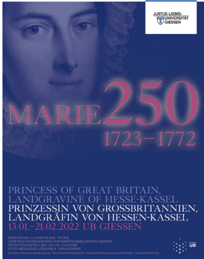
Abb. 2: Plakat der Gießener Ausstellung, 2022. (Gestaltung: Harald Schätzlein – ultraVIOLETT.de)