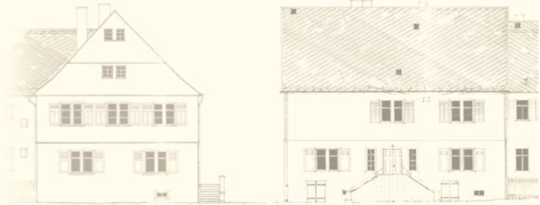
SÜD- U. STRASSEN-ANSICHT

einen »Vorturner«, bauten selbst ihre Geräte und setzten sich für Gleichheit, Freiheit und die nationale Einheit ein.