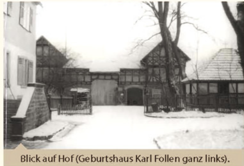
Blick auf Hof (Geburtshaus Karl Follen ganz links).

einen »Vorturner«, bauten selbst ihre Geräte und setzten sich für Gleichheit, Freiheit und die nationale Einheit ein.