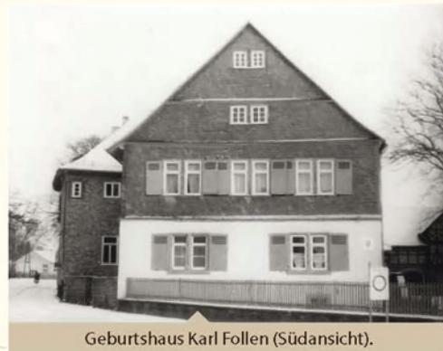
Geburtshaus Karl Follen (Südansicht).

Text und Bilder der Gedenktafel zu Ehren von Karl Theodor Christian Follen.