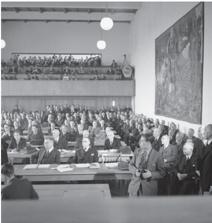
Abb. 5: Konstituierung des Parlamentarischen Rates in der Pädagogischen Akademie, Bonn, am 1. September 1948

Die von den Alliierten in den Frankfurter Dokumenten gesetzte Zweimonatsfrist war fast verstrichen, als der Konvent seine dreizehntägige Arbeit beendet hatte und der Abschlussbericht gedruckt war. Eine Woche später, am 1. September 1948, am letztmöglichen Datum, trat in einem Festakt im Zoologischen Museum König in Bonn der Parlamentarische Rat zusammen. Tagungsstätte des Rats war nicht das Museum, sondern die Pädagogische Akademie am Rhein, ein moderner und lichter Zweckbau, der 1930–33 gebaut worden war. Vier Frauen und 61 Männer hatten die elf westdeutschen Landtage nach einem vorab vereinbarten Modellgesetz gewählt. Darunter waren, wie erwähnt, sechs Mitglieder des Verfassungskonvents von Herrenchiemsee. Sieh damit überschneidend waren sechs amtierende Landesjustizminister und 52 Landtagsabgeordnete Mitglieder des Parlamentarischen Rats. Von