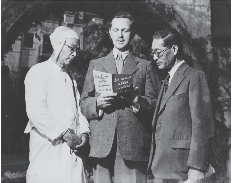
Abb. 2: Erwin Stein (1903–1992) auf einer Tagung der ersten „Weltkonferenz für moralische Aufrüstung“ 2947 in Caux/Schweiz

Militärregierung“ zurückgehen; 28 und die Ewigkeitsklausel hat Vorläufer seit dem Ende des 19. Jahrhunderts in Frankreich. 29