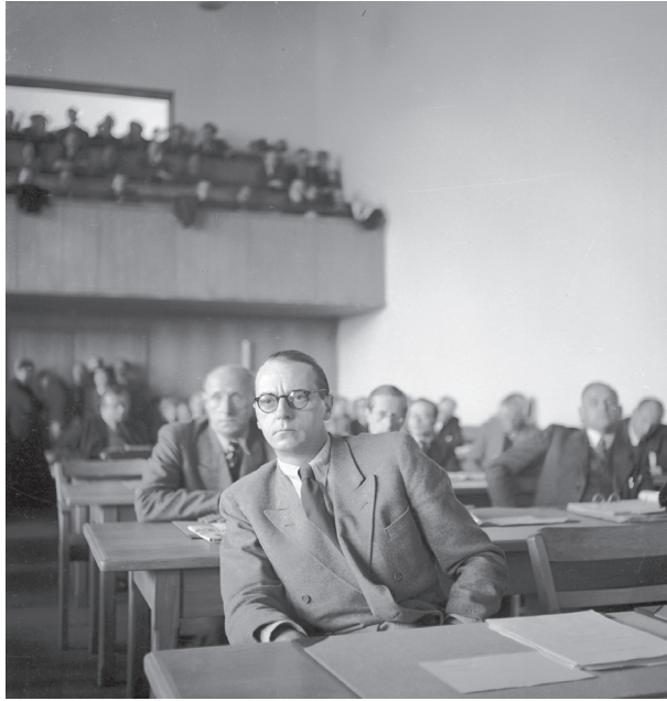
Abb. 8: Heinrich von Brentano im Parlamentarischen Rat

ses 56 nimmt er innerhalb der Unionsfraktion eine Schlüsselstellung bei der Verständigung mit den anderen Fraktionen ein.“ 57 Paradoxerweise lässt sich zugleich über seinen inhaltlichen Einfluss auf die Entstehung des Grundgesetzes wenig sagen. Das mag erstens mit seinen Funktionen zu tun haben. So bestand der Allgemeine Redaktionsausschuss nur aus drei Mitgliedern: von Brentano, 58 Dehler und Zinn. Ihre Arbeit war auf Harmonisierung der unterschiedlichen Vorschläge der anderen Ausschüsse gerichtet und ist kaum individualisierbar, zumal es keine Protokolle dieses Ausschusses gibt. 59 Der Allgemeine Redaktionsausschuss sollte große Freiheit haben 60 und hatte sie offenbar auch.