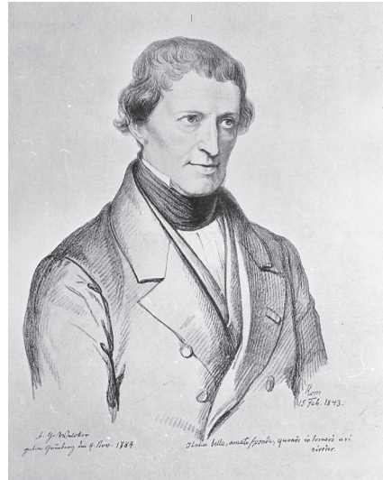
Abb. 1: Lithographie Karl Theodor Welcker, Valentin Schertle/ Künstler, HR A 22 d, Quelle Bildarchiv der Justus-Liebig-Universität Gießen