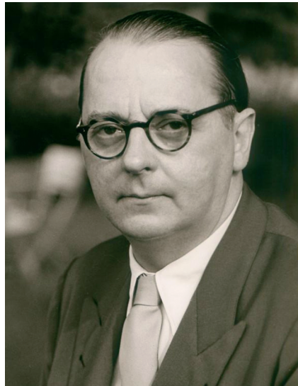
Abb. 6: Heinrich von Brentano di Tremezzo (1904–1964)