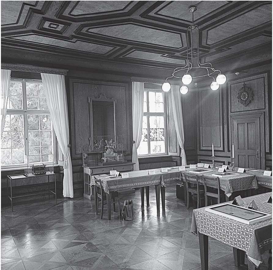
Abb. 3: Herrenchiemsee, Altes Schloss, 1. Stock: Plenarsaal des Verfassungskonvents