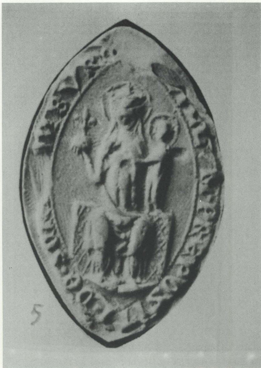
Abb. 1: Früheres Propst-Siegel. Aus: Kunstdenkmäler (Anm. 9), S. 366 Abb. 5.