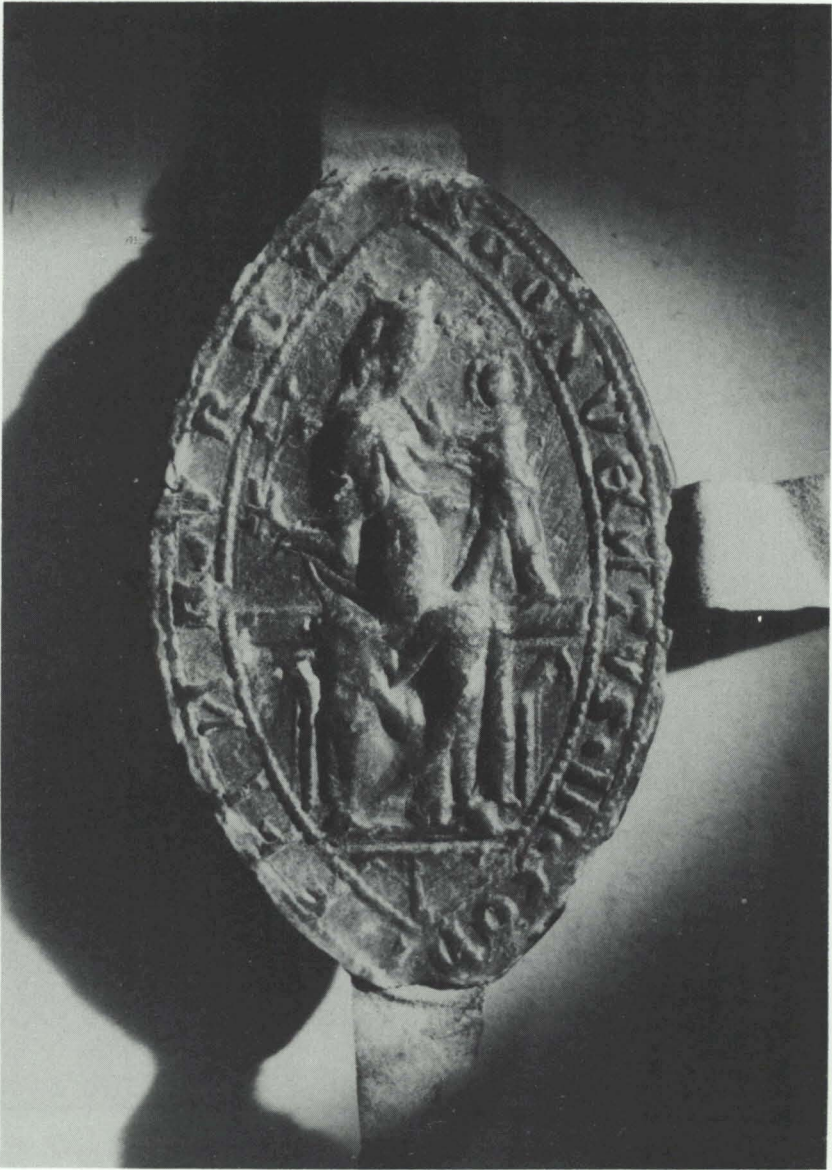
Abb. 2: Neues Konventssiegel von 1322; vgl. Anm. 16.