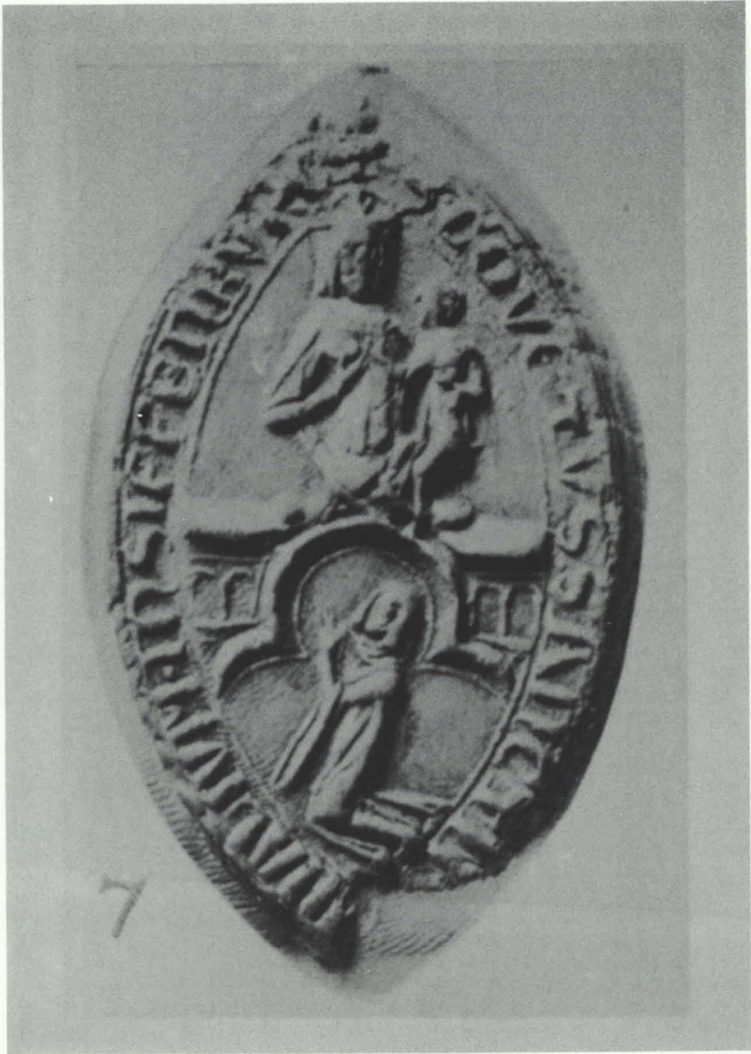
Abb. 4: Konventssiegel des Chorfrauenstiftes (Cella); vgl. Anm. 16.