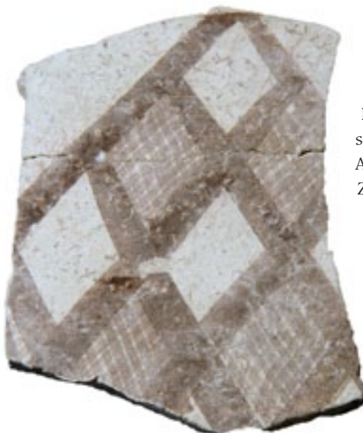
■ Abb. 6: Zyprische Scherbe. 9.-8. Jh.v.Chr.

ren Tausend Tierknochen eine intensive Haustierhaltung bereits seit der Frühen Bronzezeit erschließen. Überraschend ist dabei der hohe Anteil an Rinderknochen seit der Frühen Eisenzeit, der 44,2 % ausmacht und analog zum vorrangigen Verzehr von Rindern im Kult in der griechischen Kultur vermuten lässt, dass die Tierknochen in erster Linie von Kultmahlzeiten stammen. Schaf und Ziege mit insgesamt 27%, Schwein mit 14,2% und Damwild mit 5,8% repräsentieren die übrigen verzehrten Tierarten, wobei aus dem relativ hohen Prozentsatz von Damwild auf große Waldgebiete auf