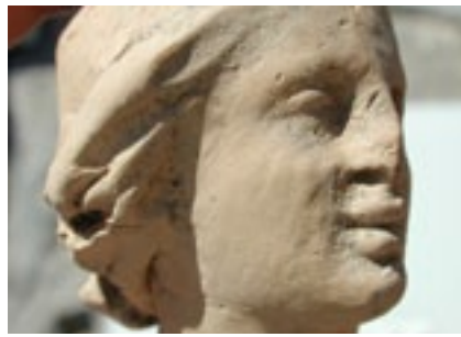
■ Abb. 7: Kopf einer Frau oder Göttin aus gebranntem Ton; 2 cm hoch. 3. Jh.v.Chr.

In dieser Zeit, in der ersten Hälfte des 7. Jhs.v.Chr., kommen auf dem Tafelberg neue Gefäße aus einem bedeutenden Zentrum der griechischen Kultur hinzu. Es sind Trinkschalen für Wein und bis zu 1,50 m hohe Vorratsgefäße mit ornamentalem Dekor, die wir leider nur als Scherben, wenn auch in größerer Anzahl, geborgen haben. Sie stammen aus dem griechischen Lindos auf Rhodos und spiegeln neue