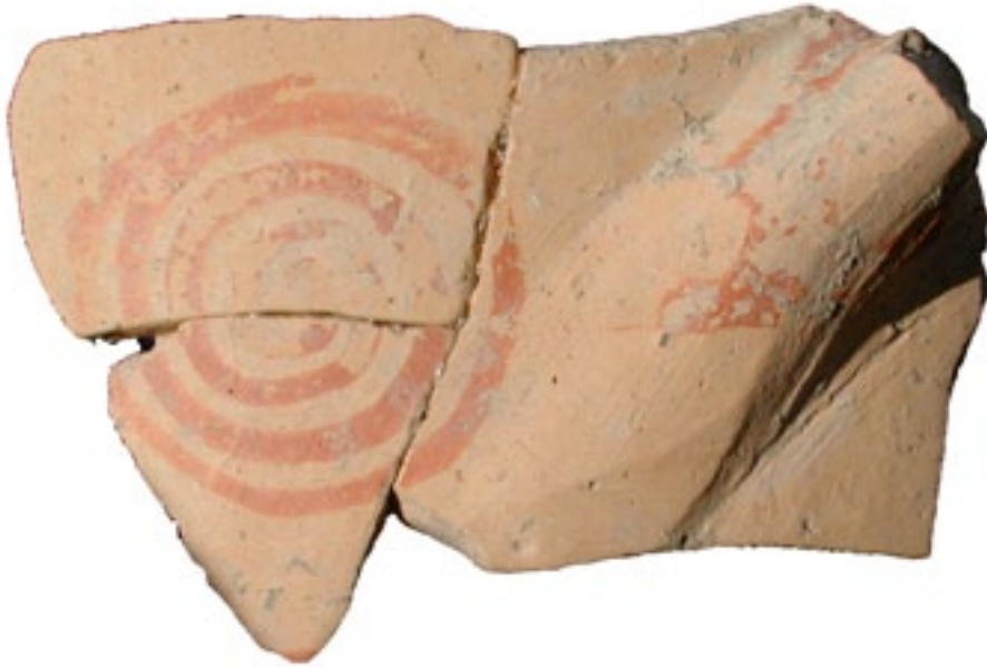
■ Abb. 5: Spätmykenische Scherbe. 12. Jh.v.Chr.

den weiten Sinterkalkterrassen westlich und nördlich von Perge geschlossen werden kann.