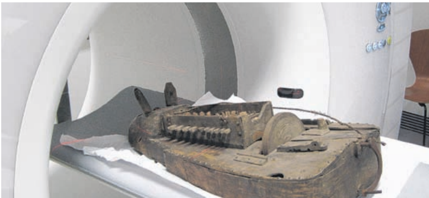
Scan einer mittelalterlichen Drehleier mittels eines Spiral-Computertomographen.