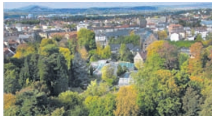
Grüne Idylle mitten in der Stadt.

Muscheln erinnern an die zoologischen Arbeiten Darwins und repräsentieren die Evolution der Tiere“, erklärt Prof. Wissemann. Die Geschiebesteine zeigen die Entwicklung der anorganischen Natur und ihre Beweglichkeit durch die Gletschertätigkeit während der letzten Eiszeit. Die Geschiebe repräsentieren zudem die Kräfte