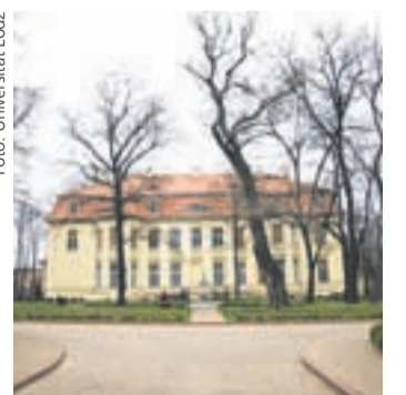
Offizieller Empfang: Auch im repräsentativen Biedermann-Palais war die Gießener Gruppe zu Gast.

Ernste Themen fanden ihren Gegenpart in der Freizeitgestaltung. So verbrachte jeder je nach Geschmack seine Abende gemeinschaftlich im Studentenwohnheim oder in den Bars der Piotrowska-Straße.