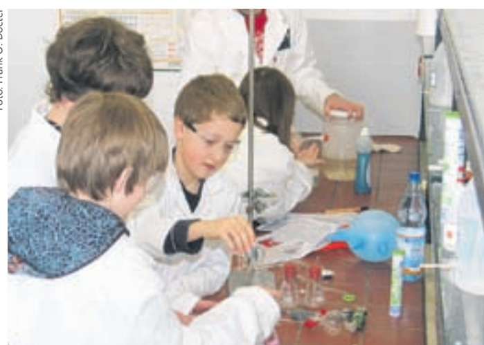
Studientag in der Chemie: Hochbegabte Schüler führen an der JLU Experimente rund um das Gas Kohlendioxid durch.

Erster Studientag für Mittelhessen – Enge Zusammenarbeit zwischen Schulen und JLU auch bei Hochbegabtenförderung