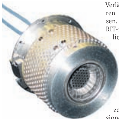
Das neue Radiofrequenz-Ionen-Triebwerk RIT-2,5 soll bei ESA- und NASA-Missionen eingesetzt werden.