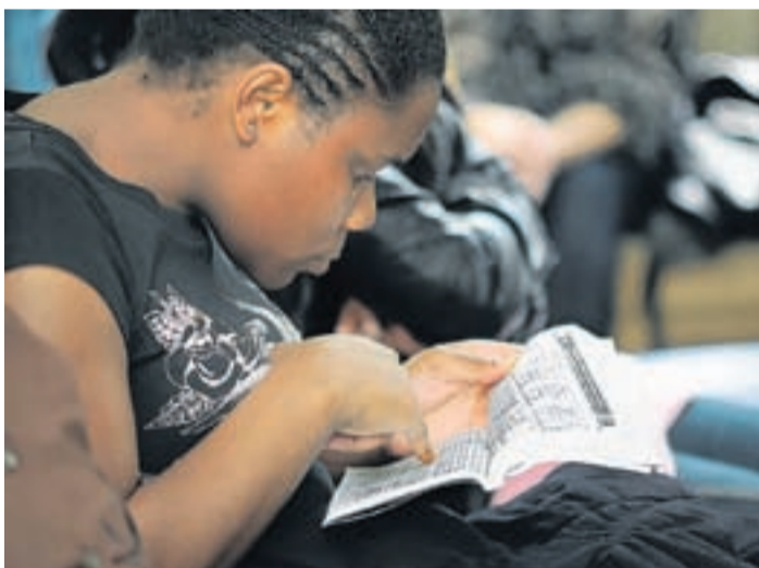
Rundum-Betreuung für die Erstsemester – dazu gehören auch Informationen rund ums Wohnen und Busfahrpläne.

Internationale Studierende werden im Zentrum von zwei festen Mitarbeitern und weiteren studentischen Tutoren betreut. Neben kulturellen Veranstaltungen soll beispielsweise auch eine Hausarbeitenhilfe angeboten werden. Auch deutsche Studierende, die ins Ausland gehen wollen, können in internationaler Atmosphäre ihren Auslandsaufenthalt vorbereiten. Zuletzt soll das Zentrum aber auch all jenen offen stehen, die nicht ins Ausland gehen können, aber trotzdem Kontakt zu internationalen Studierenden suchen.