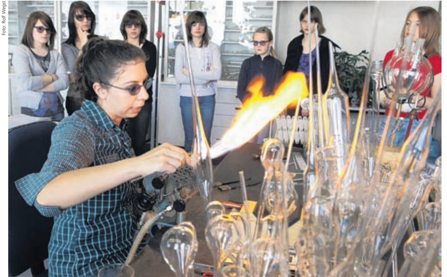
Kunstwerke aus der Glasbläserei: Die Mädchen waren beim Girls' Day mit viel Engagement bei der Sache – die Organisatoren hatten sich ein abwechslungsreiches Programm einfallen lassen.

Weitere Informationen: www.uni-giessen.de/personalrat/