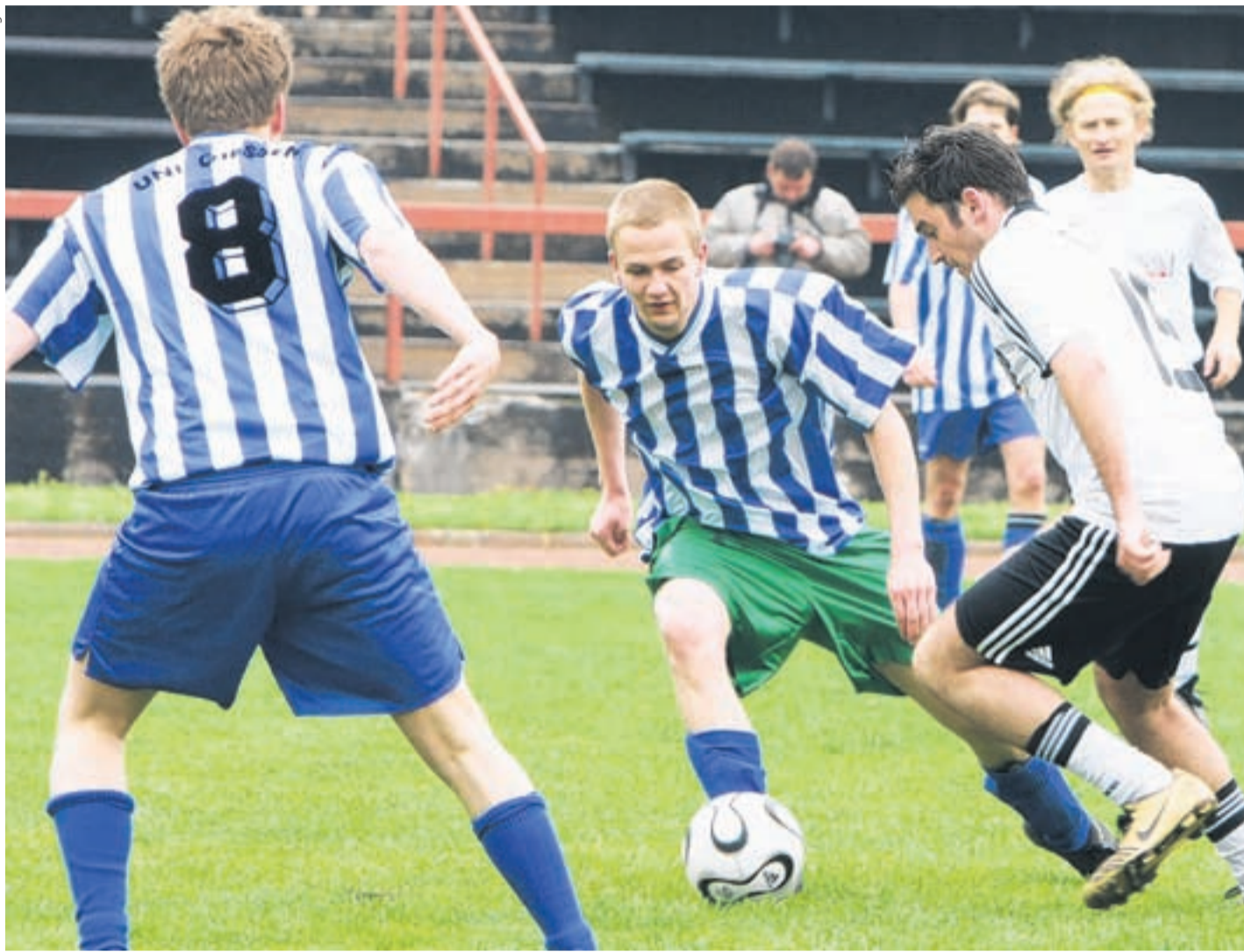
Sport trifft auf Kultur: Spannend war die Partie zwischen der Autorennationalmannschaft und einer Auswahl des Instituts für Germanistik am Kugelberg.

Das Fußballspiel der Autoren gegen eine Auswahl des Instituts für Germanistik konnten die Gastgeber mit 5:4 auf dem Uni-Sportgelände am Kugelberg knapp für sich entscheiden. Für die Autoren ging die sportliche Herausforderung am Abend mit einer Lesung im Georg-Büchner-Saal in der alten Universitätsbibliothek weiter.