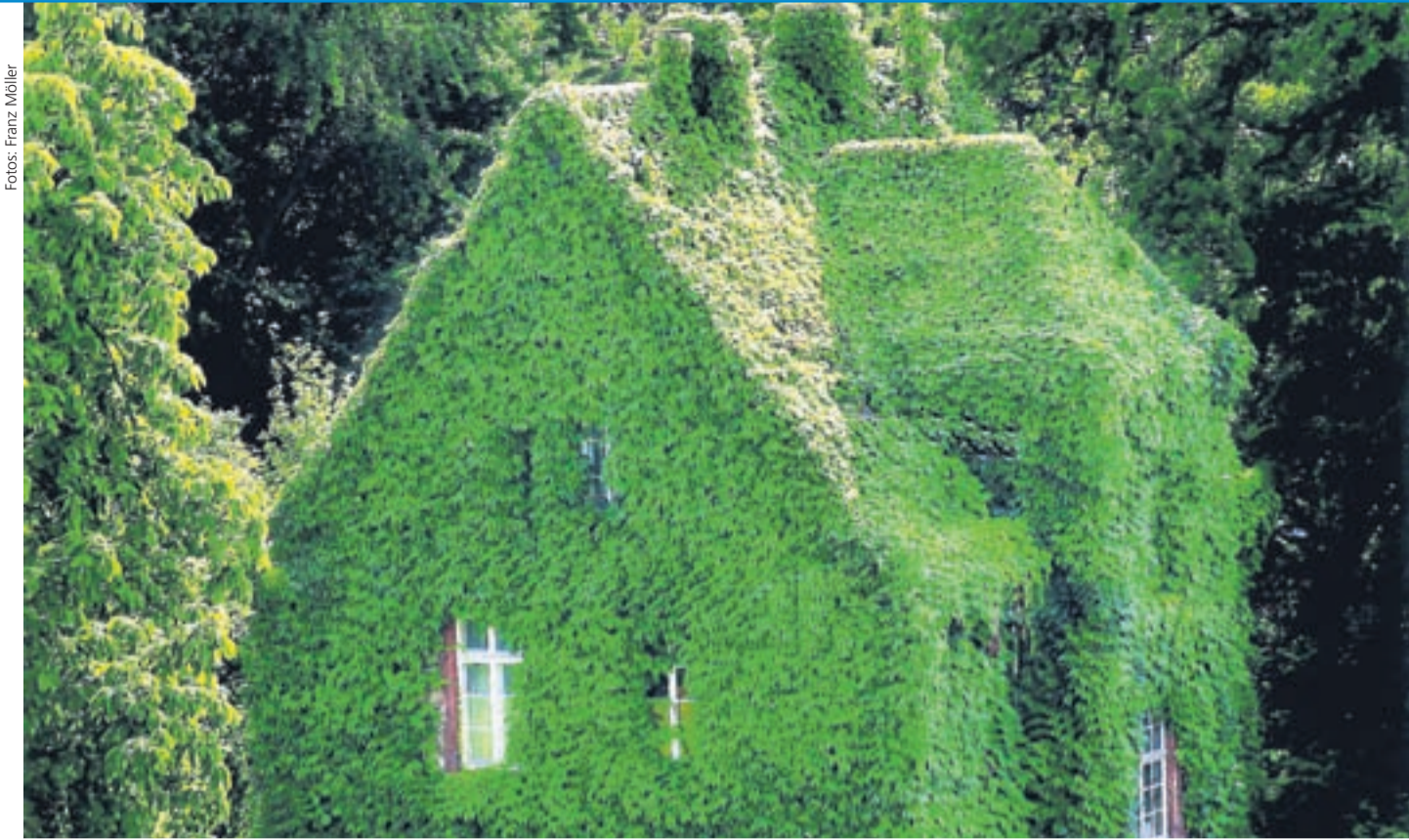
Natur pur: Schmuckstücke im Botanischen Garten.

Der Senat hatte vor einiger Zeit den Wunsch geäußert, die Verteilung der studentischen Kommissionsmitglieder sollte die unterschiedlichen Fachbereiche möglichst angemessen repräsentieren. Die studentischen Senatsmitglieder begründeten die getroffene Auswahl, die diesem Wunsch nicht strikt gefolgt ist, mit der Erfahrung der benannten Personen in der bisherigen Kommissionsarbeit und mit dem gesamtuniversitären Interesse, das es gelte, in der Kommission zu vertreten. Eine rechtliche Verpflichtung zur Berücksichtigung