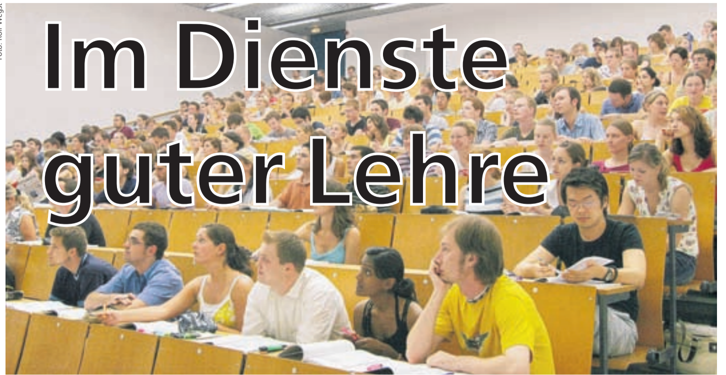
Gute Lehre ist mehr als Frontalunterricht: Das Hochschuldidaktische Netzwerk Mittelhessen (HDM) leistet einen wichtigen Beitrag zur Verbesserung der Qualität der Lehre.

http://www.uni-giessen.de/hrz/komm/label/