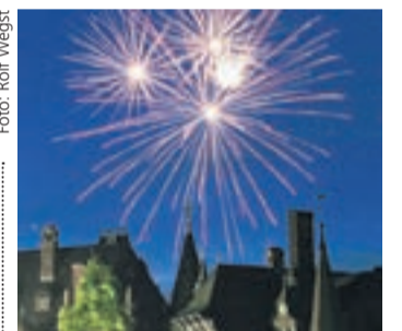
Highlight: Beim Uni-Sommerfest darf das große Feuerwerk nicht fehlen.

Es ist eine feste Größe im Terminkalender: Das Uni-Sommerfest auf Schloss Rauschholzhäusern am Samstag, 4. Juli 2009, wird zweifelsohne einer der Höhepunkte des laufenden Sommersemesters sein. Oliver Behnecke, bekannt als Koordinator des Uni-Jubiläums 2007 und Garant für gelungene Feste und Festivals, wird in diesem Jahr die künstle-