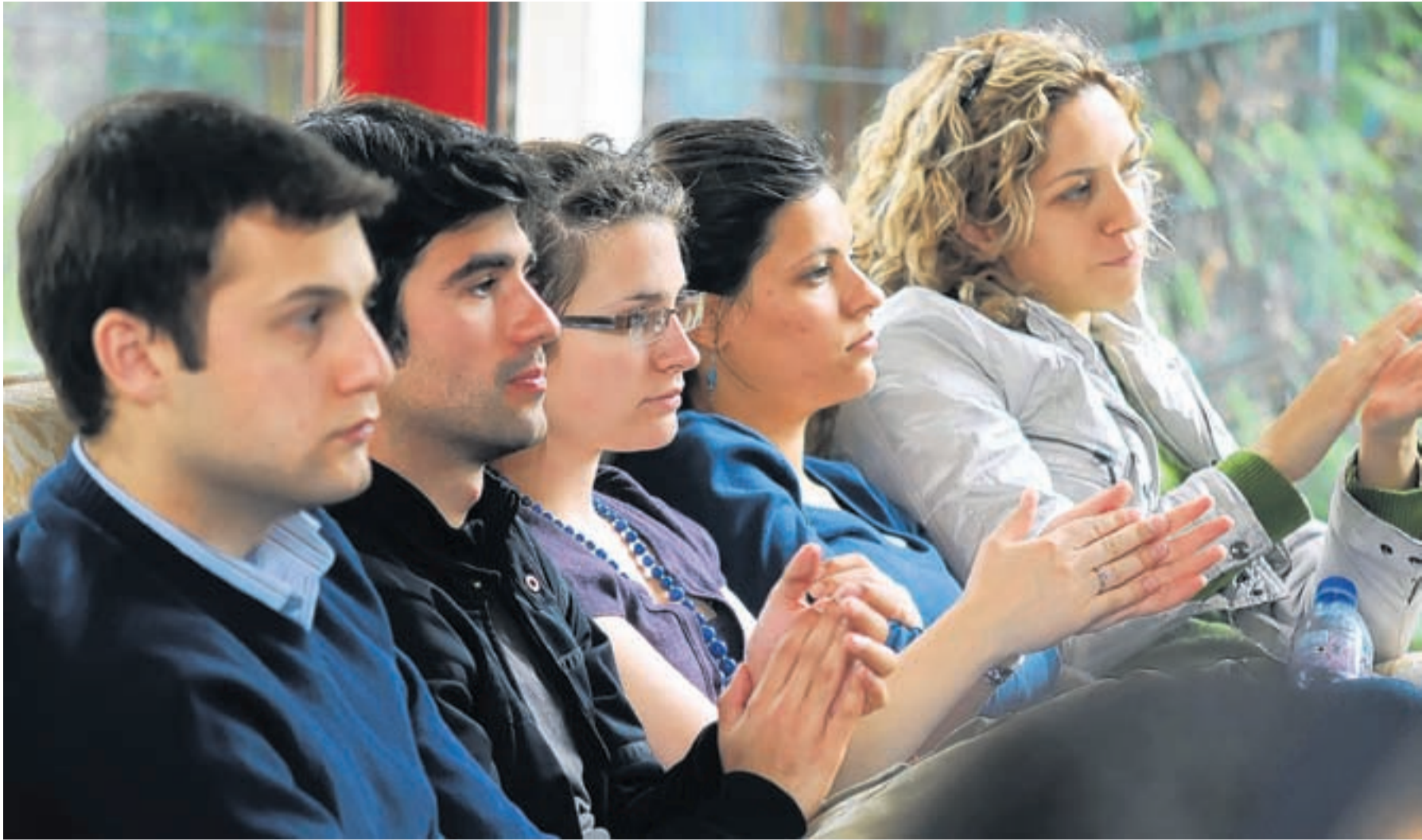
Gut aufgehoben fühlen sich die ausländischen Studierenden an der JLU, wo sie vom 1. Vizepräsidenten begrüßt wurden. Viele universitäre und studentische Einrichtungen stellten sich vor und erleichterten den Studierenden so den Start in Gießen.