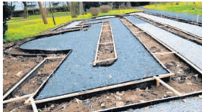
Auf Darwins Pfaden wandeln.

Symbolische Bezüge stellen auch die Muschelschalen und die eiszeitlichen Geschiebesteine im Sand des Pfades dar: „Die