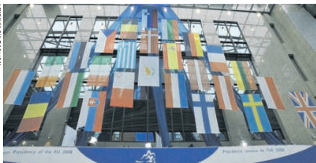
In 27 EU-Mitgliedsstaaten sind die Bürgerinnen und Bürger zur Wahl eingeladen.

letzten Wohnort in Deutschland ins Wählerverzeichnis eintragen lassen. Das Gleiche gilt natürlich auch für die EU-Bürger aus den 26 übrigen Mitgliedsstaaten mit