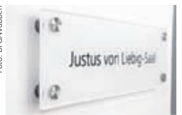
Die DFG würdigt das Schaffen des Namensgebers der JLU.