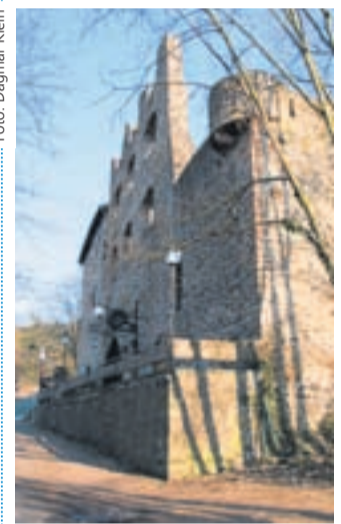
Auf der Badenburg wurde der Hessische Landbote geschrieben.

In Gießen erinnert seit 2006 eine Porträtbüste am Alten Schloss an den posthum als Dramenautor berühmt gewordenen Büchner. Aktuell ist in der Kunsthalle (24.4.-17.5.) eine Dokumentationsausstellung des Hessischen Staatsarchivs Darmstadt zu sehen.