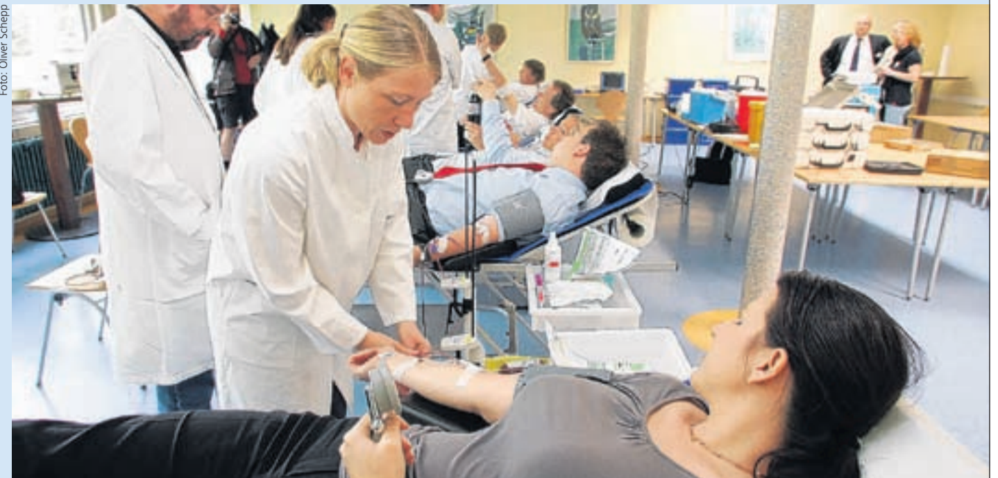
Blutspenden – ohne Aufwand: die Aktion „Campusblutspende“ macht es möglich.

Aktion „Campusblutspende“: Institut für Transfusionsmedizin dienstags und donnerstags vor Ort in der Mensa