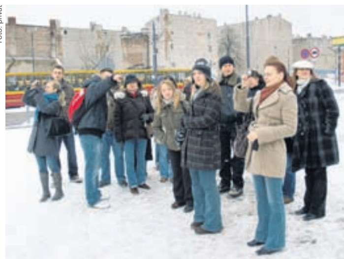
Keine Exkursion ohne Gruppenfoto.

Die Vorbereitungskurse fanden im Gebäude des ehemaligen deutschen Lodzer Gymnasiums statt, in dem sich heute das Institut für Polonistik befindet. Die Studierenden wurden in verschiedene