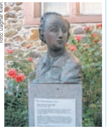
Eine Porträtbüste erinnert am Alten Schloss an den posthum als Dramenautor berühmt gewordenen Georg Büchner.

der 175. Jahrestag des „Hessischen Landboten“. Die revolutionäre Flugschrift wurde von