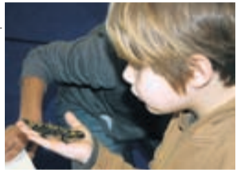
Keine Scheu: Neugierig beobachtet dieser Junge einen Feuersalamander.