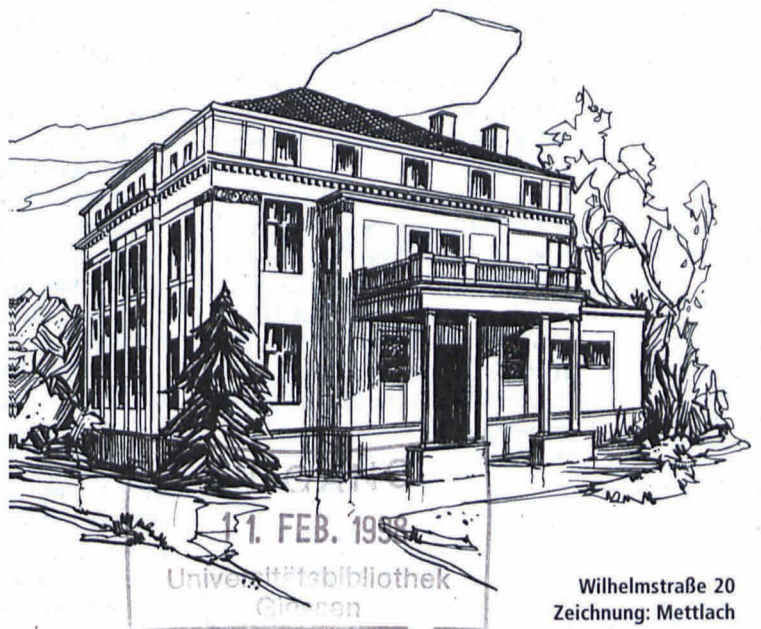
Wilhelmstraße 20