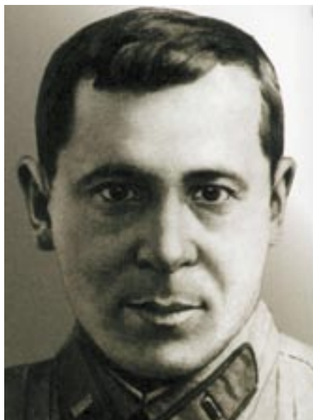
Abb. 1: Musa Dschälil, tatarischer Dichter, geb. 1906 im Bezirk Orenburg, Russland; hingerichtet in Berlin im August 1944

Das in der ehemaligen DDR im Rahmen der deutsch-sowjetischen Freundschaft gepflegte Erinnern an den in Nazi-Deutschland hingerichteten Dichter verblasste allerdings mit den Veränderungen