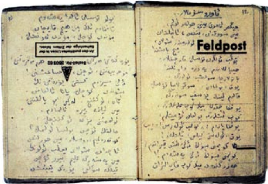
Abb. 3: Die Moabiter Hefte, Gedichte von Musa Dschälil.

Stil des sozialistischen Realismus gestaltete monumentale Denkmalsanlage für Musa Dschälil und seine Mitstreiter verweist aber inzwischen auch mit nachträglich angebrachten Inschriften in arabischer Schrift auf die islamische Herkunft des Schriftstellers. Zahlreiche Publikationen zum Leben des Autors, kritische Gesamtausgaben, beeindruckenden Faksimiles der Moabiter Hefte (Abb. 2 und 3) und kindgerechte Zusammenstellungen ausgewählter Gedichte zeugen von der unverminderten Wirkkraft des Dichters in postsowjetischen Zeiten.