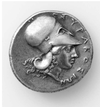
Abb. 1a-b: Zwei der frisch restaurierten Münzen, die von der sizilischen Stadt Syrakus geprägt wurden.