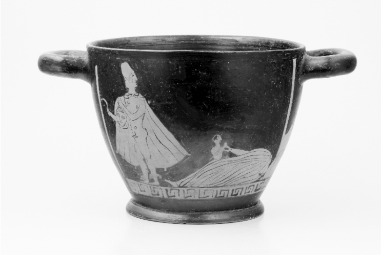
Abb. 3: Dieser Trinkebecher vom Ende des 5. Jhs. v. Chr. stammt aus einer Werkstatt in der Nähe von Neapel und zeigt die Enthauptung der Gorgo Medusa durch den griechischen Helden Perseus.

Die bereits im Frühjahr 2010 mit großem Erfolg in Gießen gezeigte Ausstellung „Herakles & Co.“ (s. MOHG 95, 210, 270) wurde am 28.10.2011 im Stadtmuseum Jena eröffnet (bis 19. 2. 2012). Durch Zusammenarbeit mit der Antikensammlung der Universität Jena werden rund 160 Objekte – die Hälfte davon als Leihgabe der Gießener Antikensammlung – aus allen Bereichen des antiken Kunstschaffens gezeigt, die die Welt der Götter und Helden des antiken Griechenlands ins Zentrum stellen.