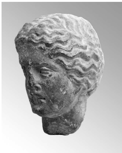
Abb. 5: Der Marmorkopf stammt von einem attischen Hochrelief des späten 5. Jahrhunderts v. Chr. und weist große Ähnlichkeiten mit dem Fries des Erechtheions auf der Athener Akropolis auf.

Bereits am 4. 9. 2010, während der „Langen Nacht der Museen und Galerien“ in Münster, war die Gießener Ausstellung „Kult-Tisch. Kyprische Keramik im Kontext“ zu sehen, die anlässlich des 90. Geburtstages von Prof. Dr. Hans-Günter Buchholz im Frühjahr 2010 im Wallenfels'schen Haus in Gießen veranstaltet worden war. Im Sommer 2012 soll sie über einen längeren Zeitraum im Museum der archäologischen Sammlung der Universität Münster gezeigt werden.