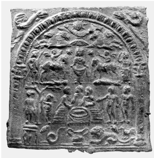
Abb. 4: Eines der als „Donaureiter“ bezeichneten Votivtäfelchen aus Blei, das derzeit als Leihgabe der Gießener Antikensammlung in der Saalburg zu sehen ist.