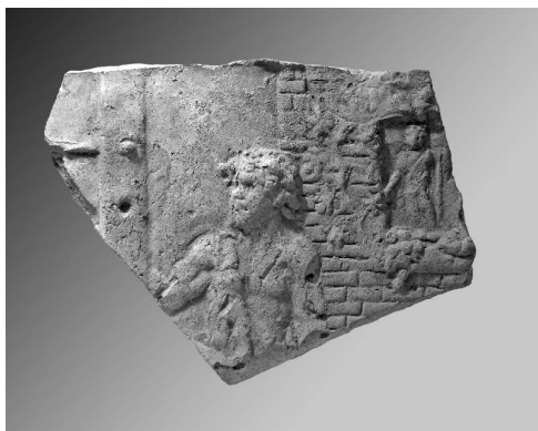
Abb. 6: Das Fragment einer so genannten Campana-Platte aus Terrakotta zeigt einen mit Fell bekleideten Satyrn vor einem ländlichen Heiligtum.