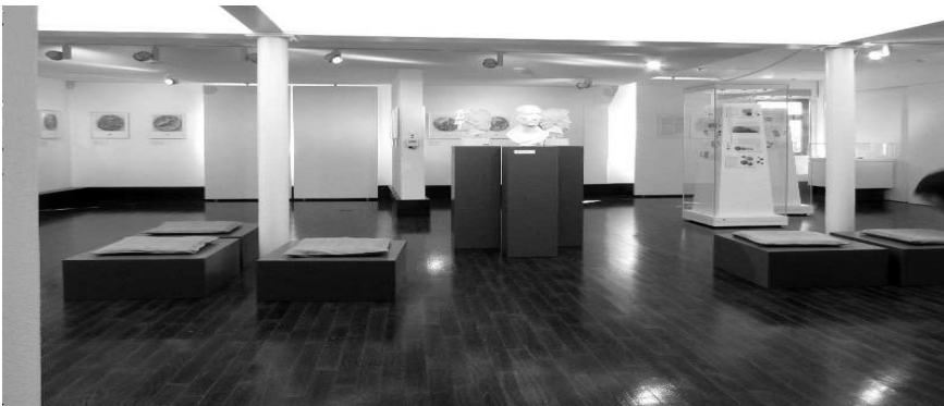
Abb. 2: Blick in die Münz-Ausstellung „Bare Kunst“ im Museum im Spital Grünberg.

Die frisch restaurierten Münzen wurden am 23. September 2011 erstmals wieder der Öffentlichkeit präsentiert, und zwar in Form einer Sonderausstellung im Museum im Spital Grünberg (Abb. 2). In der Geburtsstadt Friedrich Gottlieb Welckers, des Gründungsvaters der Klassischen Archäologie an der Universität Gießen, veranstaltete die Antikensammlung damit bereits zum dritten Mal eine Sonderausstellung, die eigens für das Grünberger Museum konzipiert wurde. Bis zum 15. Januar 2012 waren unter dem Titel „Bare Kunst. Meisterwerke im Miniaturformat“ rund 100 Münzen zu sehen, davon 30 in großformatigen Fotos. Ziel der Ausstellung ist es, antike Münzen nicht nur unter wirtschaftsgeschichtlichen und historischen Aspekten zu betrachten, sondern sie als originale Kunstwerke ihrer Zeit zu würdigen. Im Vergleich zu den heutigen Münzen erstaunen die ungeheuere Plastizität und das Volumen in den nur Bruchteile von Millimetern tiefen Reliefs. Tausend Jahre Münzkunst sind durch herausragende Exemplare vertreten, die vom 6. Jh. vor Christus bis zum 4. Jh. nach Christus reichen. Die Ausstellung konzipierte Dr. Matthias Recke, Kustos der Antikensammlung, zusammen mit Dr. des. Philipp Kobusch. Zur Ausstellung ist ein reich illustrierter Begleitband erschienen.