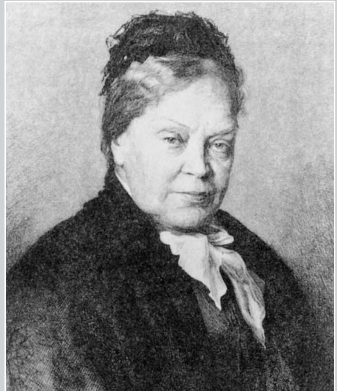
Marie von Ebner-Eschenbach (1830–1916).

Das Seminar wird durch die Frauenbeauftragte der JLU gefördert.