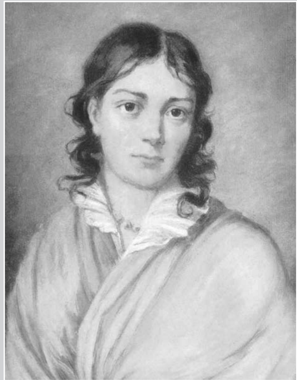
Bettina Brentano (1785–1859).