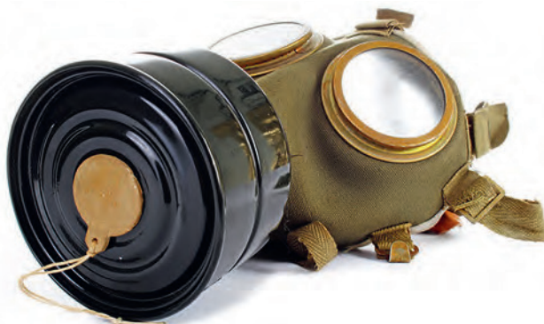
Gasmaske aus dem Ersten Weltkrieg.

Ohne das Haber-Bosch-Verfahren, mit dessen Entwicklung Haber etwa im Jahr 1904 begann, könnten heute nicht rund sieben Milliarden