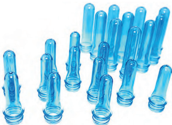
Polyethylene-Terephthalat-Rohlinge für Getränkeflaschen.

Ohne Zweifel hatte Haber einen enormen wissenschaftlichen Durchbruch erreicht, der im wahrsten Sinn des Wortes „im verflochtenen Jahr der Menschheit die größten Verdienste erwiesen haben“ ist, so wie es Alfred Nobel zur Vergabe von Preisen aus seiner Stiftung gefordert hatte.