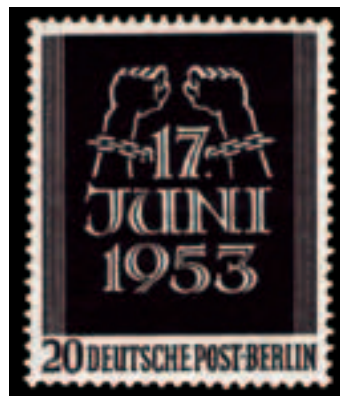
Briefmarke der Deutschen Bundespost zum 17. Juni 1953.

als Putschversuch und „westliche Verfremdung“ abgetan wurde, setzte er in Teilen der Bevölkerung der DDR und vor allem auch in der Bundesrepublik einen besonderen Prozess der Erinnerung in Gang. Keine zwei Monate nach den Ereignissen gab die Deutsche Bundespost bereits Gedenkbriefmarken heraus, die mit dem Motiv von kettensprengenden Arbeiterhänden den Protest gegen die DDR-Diktatur beschworen.