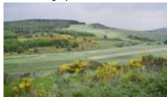
Das Lahn-Dill-Bergland, Modellregion des SFB 299

IFZ-Schwerpunkt Landnutzungsoptionen und Biodiversität