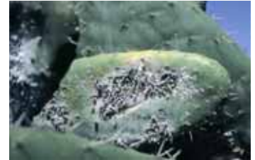
In Salami, Campari und Lippenstiften: Karmin aus der Nopal-Schildlaus, kultiviert auf Opuntia-Kaktus (Lanzarote)