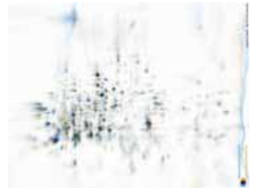
Die 2-D-Gelelektrophorese zeigt veränderte Proteilmuster in Pflanzen unter Säurestress