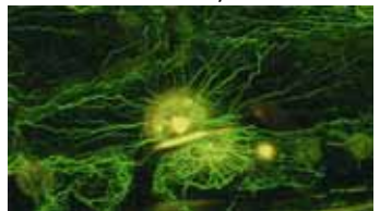
Eine pilzinfizierte Gerstenzelle, Modellsystem der FOR 666

IFZ-Schwerpunkt Stressresistenz und Adaptation