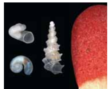
Biodiversität von Weichtieren: Mikrogastruden aus Mazedonien (Streichholzkuppe als Größenvergleich)