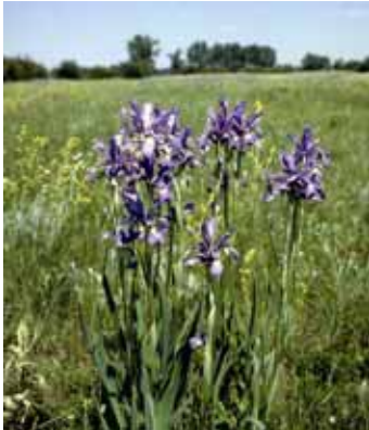
Die extrem seltene Bastardschwertillie ( Iris spuria ) soll im Rahmen eines DBU-Projektes wieder angesiedelt werden.