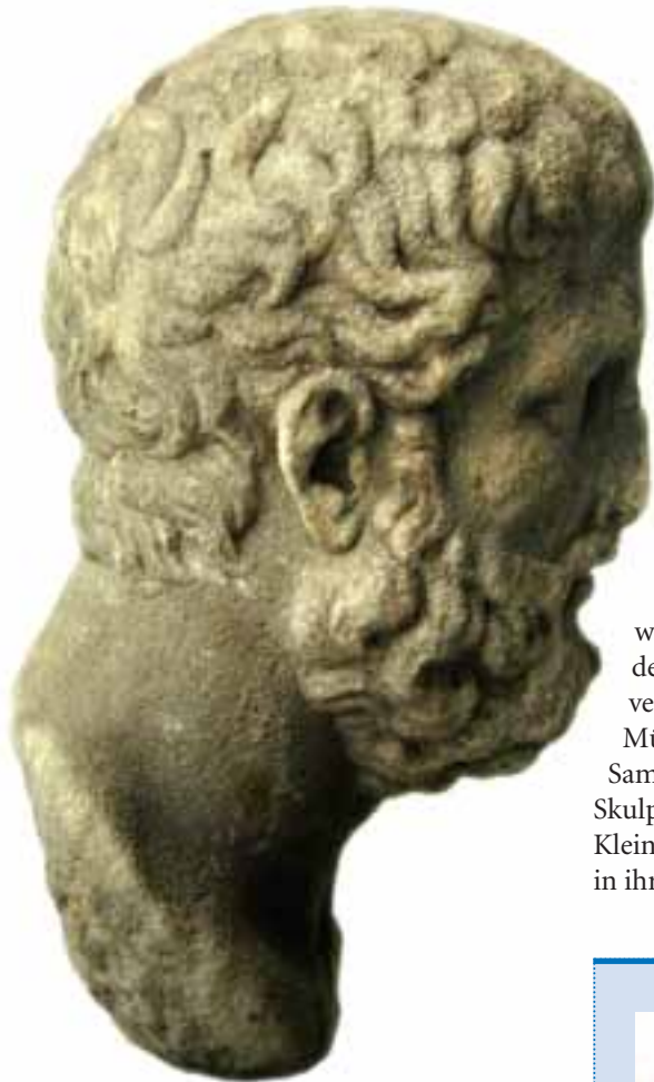
Abb. 14: Porträt des griechischen Philosophen Metrodor (3. Jh. v. Chr.). Schenkung Wilhelm Gails anlässlich des Universitätsjubiläums 1907.

war. Seiner ersten Publikation über diese aufsehenerregende Entdeckung folgte im Jahr darauf eine weitere Abhandlung über die wieder gewonnene Gruppe (Abb. 15), die auch eine umfangreiche und ins Detail gehende Kopienkritik des Typus liefert – eine bis heute fundamentale Methode, die Sauer als einer der ersten im Detail angewendet hat. Die Wiedergewinnung der klassischen Statuengruppe hat bis heute Bestand und verknüpft das Andenken