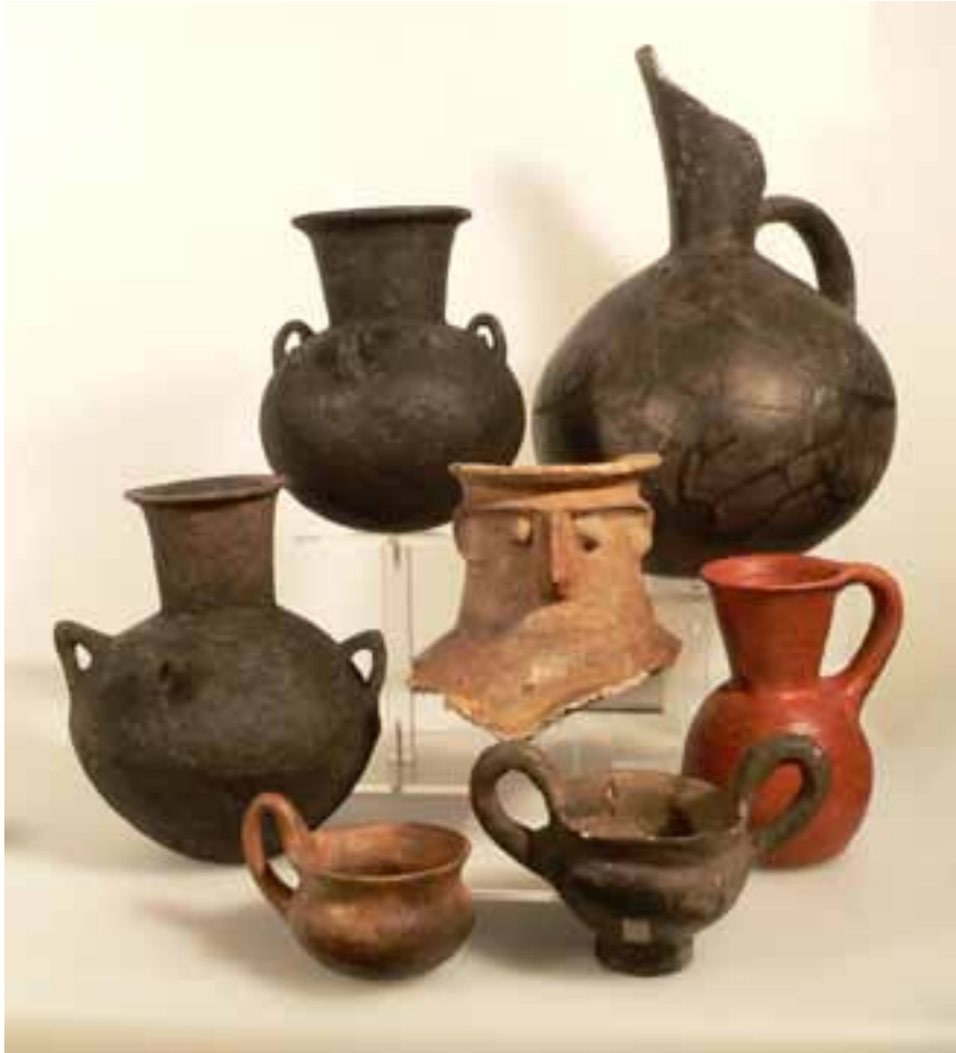
Abb. 10: Auswahl an frühbronzezeitlicher Keramik (2600–2100 v. Chr.), die Heinrich Schliemann in Troja ausgegraben hat.

Sammlung an: „ Da für den Hauptteil des Kunst-, Münzen und Antikenkabinetts der Name „Archäologisches Museum“ bereits offiziell, nämlich im Vorlesungsverzeichnis in Gebrauch ist, schlage ich vor, das Kunst-, Münzen und Antikenkabinett ... Archäologisches Institut ... zu benennen. “