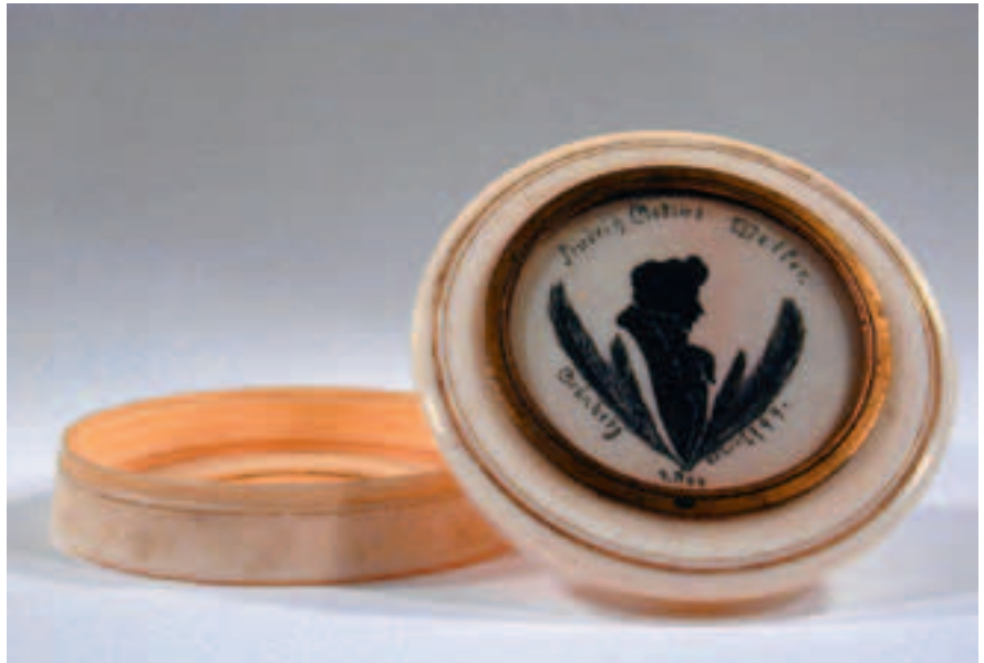
Abb. 1: Diese bislang unpublizierte Schnupftabakdose aus Elfenbein trägt das früheste bekannte Bild Friedrich Gottlieb Welckers (4.11.1799). Die Schreibweise ‚Welcker‘ oder ‚Welker‘ war damals uneinheitlich; in den Ahnentafeln dieser Zeit sind beide Varianten belegt. Heute hat sich die Schreibweise von Friedrich Gottlieb Welcker mit ‚ck‘ eingebürgert.

Die Liebe zur Antike verlässt ihn zeit seines Lebens nicht mehr: Von seiner Anstellung am Gießener Paedagogium, an dem er seit Herbst 1803 unterrichtet, lässt er sich bereits nach drei Jahren wieder beurlauben, um 1806 nach Rom zu reisen. Der insgesamt auf anderthalb Jahre ausgedehnte Aufenthalt in Rom prägt den jungen Mann tief. Die Ruinen der antiken Bauten und die großen Sammlungen antiker Kunst üben eine gewaltige Faszination auf ihn aus. So schreibt er 1807 an seinen Vater: „Was ist die Beschäftigung mit Büchern gegen das Anschauen solcher Werke, und wie leblos ist uns Sophokles selbst gegen die göttliche Höhe, Freude und Reiz, die von