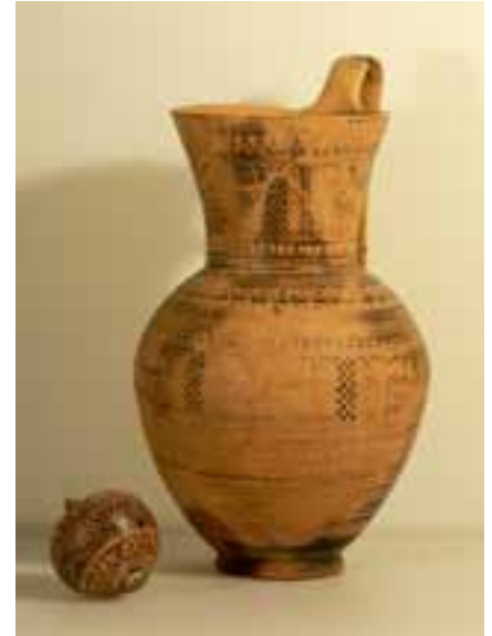
Abb. 11: Kinderrassel und Kanne: Geometrische Keramik aus Athen (um 750/730 v. Chr.), 1905 von Hugo Hepding in Griechenland erworben.

nichtet wurden, lässt sich dieser Abschnitt der Sammlungsgeschichte inzwischen recht gut rekonstruieren. So tätigt Sauer die ersten Ankäufe 1899 auf Auktionen, die bei dem Kunsthändler Hugo Helbing in München stattfinden. Aus der Sammlung des in Würzburg verstorbenen griechischen Malers und vormaligen Professors der Kunsthochschule in Athen, Philipp Margaritis, kann er etliche antike Vasen, Terrakotten, und sogar das Fragment eines Grabreliefs aus Marmor (Abb. 9) erwerben. Zahlreiche weitere Ankäufe und auch Schenkungen folgen. 1903 wird der Antikensammlung auf kaiserliche Anordnung eine große Anzahl von Fundstücken – weit über 1000 Inventarnummern – überlassen, die