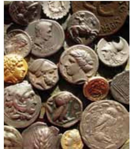
Abb. 5: Die bedeutende Münzsammlung umfasst über 3700 kostbare Gold-, Silber und Bronzemünzen.

Eine weitere bedeutende Erweiterung der Abguss-Sammlung, die bis heute