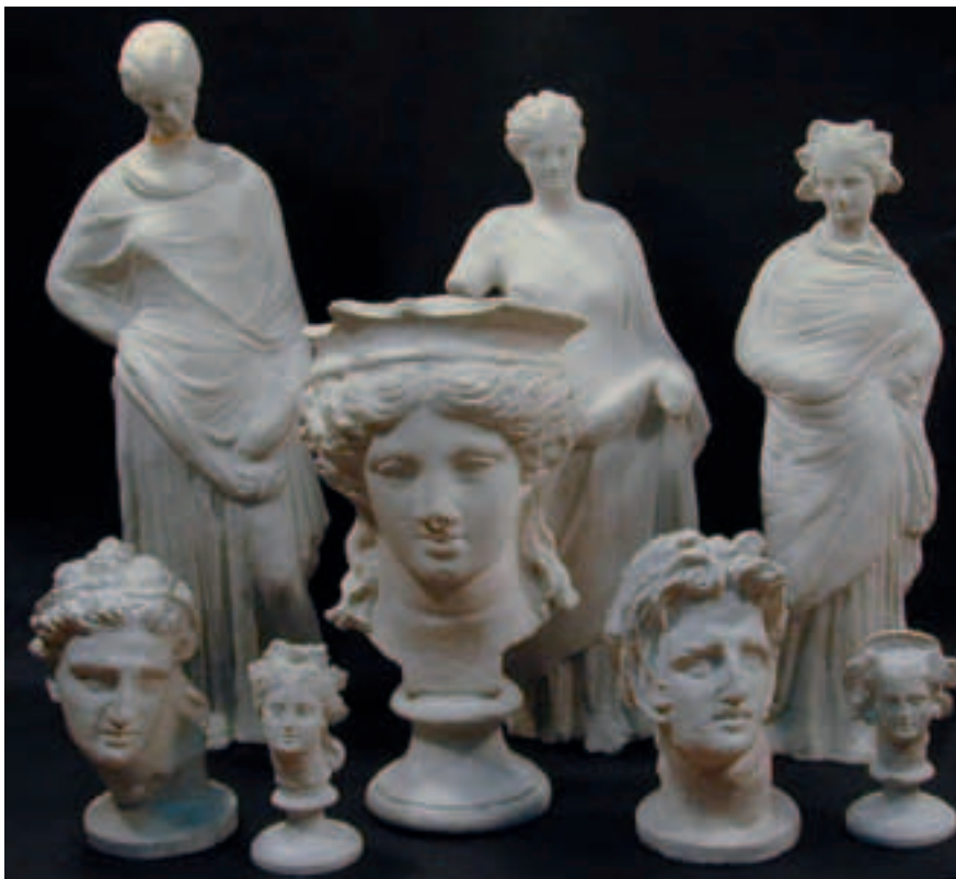
Abb. 4: Um 1844 wurden diese einzigartigen Gipsabgüsse von hellenistischen Terrakotten der Sammlung Fogelberg in Rom angefertigt.