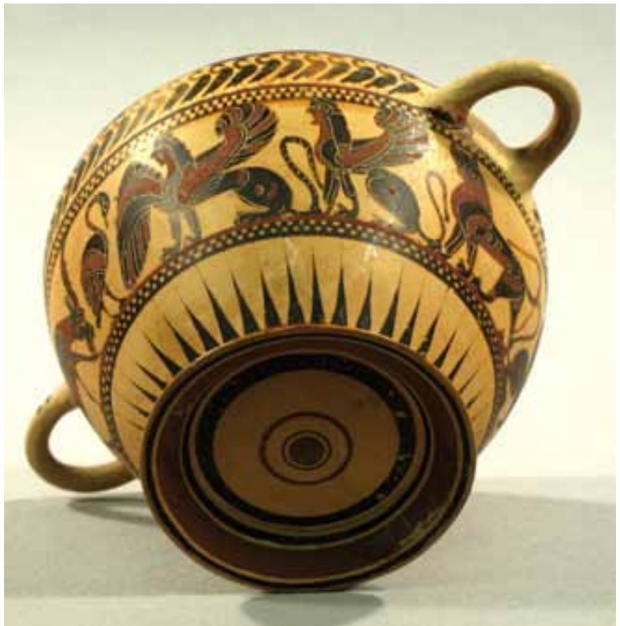
Abb. 13: Korinthischer Trinkbecher (Kotyle) des „Gießener Malers“ mit Tierfries: Steinbock, Schwan, Sphingen und Löwe (um 570 v. Chr.).