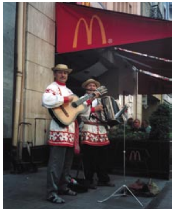
... sind in Polen oft ganz dicht beieinander.