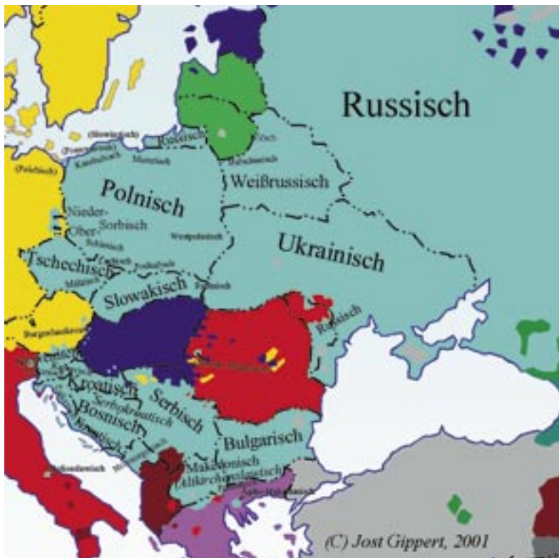
Aktuelle Gliederung des slavischen Sprachen.