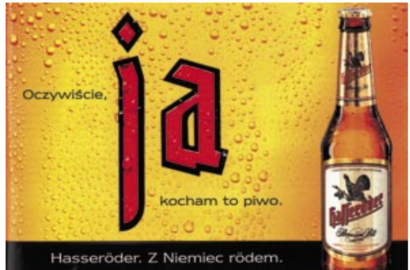
Produktwerbung in Polen: „Natürlich, ich liebe dieses Bier ...“

Dies sind einige der Tendenzen, die die Sprachsituation in Polen heute prägen. Gerade die Tendenzen der Internationalisierung und der Vul-