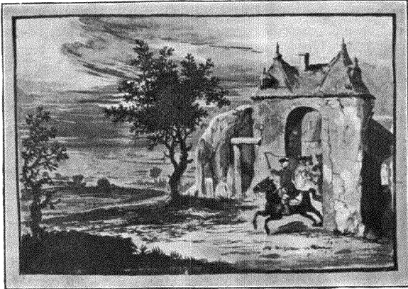
Aus einem Stammbuch von 1771.

„Wer von Gönnern, wer von Freunden Mir wird hold und günstig seyn, Schreibe seinen werthen Namen Mir in dießes Stammbuch ein; Ich will zur Erkenntlichkeit Ihn dafür ins Herze schreiben, Und bis in das kühle grab Sein ergebner Diener bleiben.“