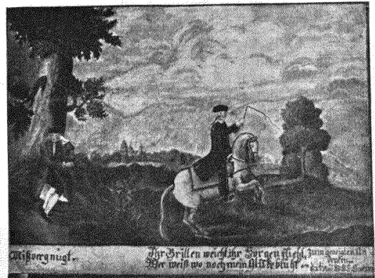
Aus einem Stammbuch von 1771.

Zintgreff erzählt in seinen Sprüchen (1639) schon ähnliches von dem Darmstädter Landgrafen Ludwig V. Den beruft seine Umgebung, er solle sich doch fürstlicher kleiden, und er darauf: „Je höher und größer, je demütiger und niederträchtiger, man kennt mich doch.“ Im Stammbuch von 1750 ist das Epigramm zur ausgemalten Geschichte geworden, die Tendenz hatte ins Breite gewirkt. Sie ist ja bescheiden genug; der Rang wird durch Menschenwert bestätigt, noch nicht erworben, noch nicht erseht, aber an „großmütigen Handlungen guter Fürsten“ hat man nach und nach demokratisch denken gelernt. Das neue Bewußtsein kam