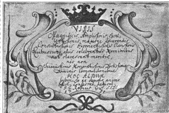
Stammbuchtitel von 1750.

Leben, das der ganzen Regelwelt durchforsteten Geschmacks und beruhigter Wissenschaft entgegenstand; nicht einzuordnen und darum ärgerlich war das Studentenwesen überhaupt, soweit der Student etwas anderes sein wollte als Hörer der Kollegia.