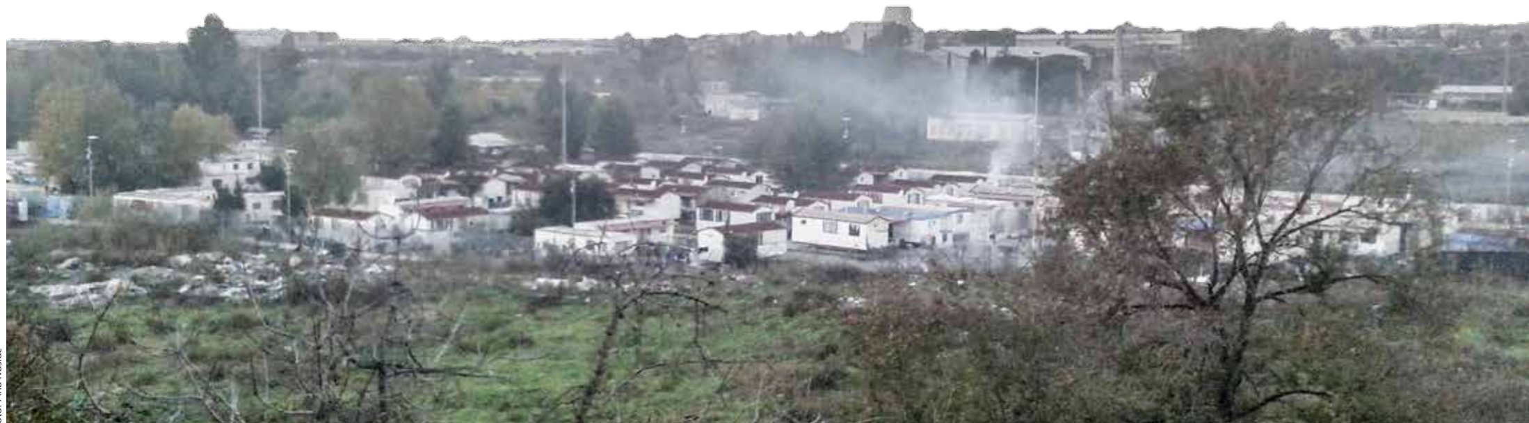
Das Roma-Lager Salone außerhalb von Rom dient mit seinen hohen Zäunen eher der Ausgrenzung der Minderheit denn einer gelungenen Integration.

Die meisten Teilprojekte betrachten das Thema historisch. So werden etwa die Kreuzfahrerherrschaften des Nahens Ostens, dynastische Eheverträge, konfessionelle Minderheiten und der Landfrieden in der Frühen Neuzeit untersucht. Es geht aber auch um die internationale Ächtung des Genozids, um Staatssicherheit, militärisches Engagement im Ausland und politische Sicherheit nach der Weltfinanzkrise.