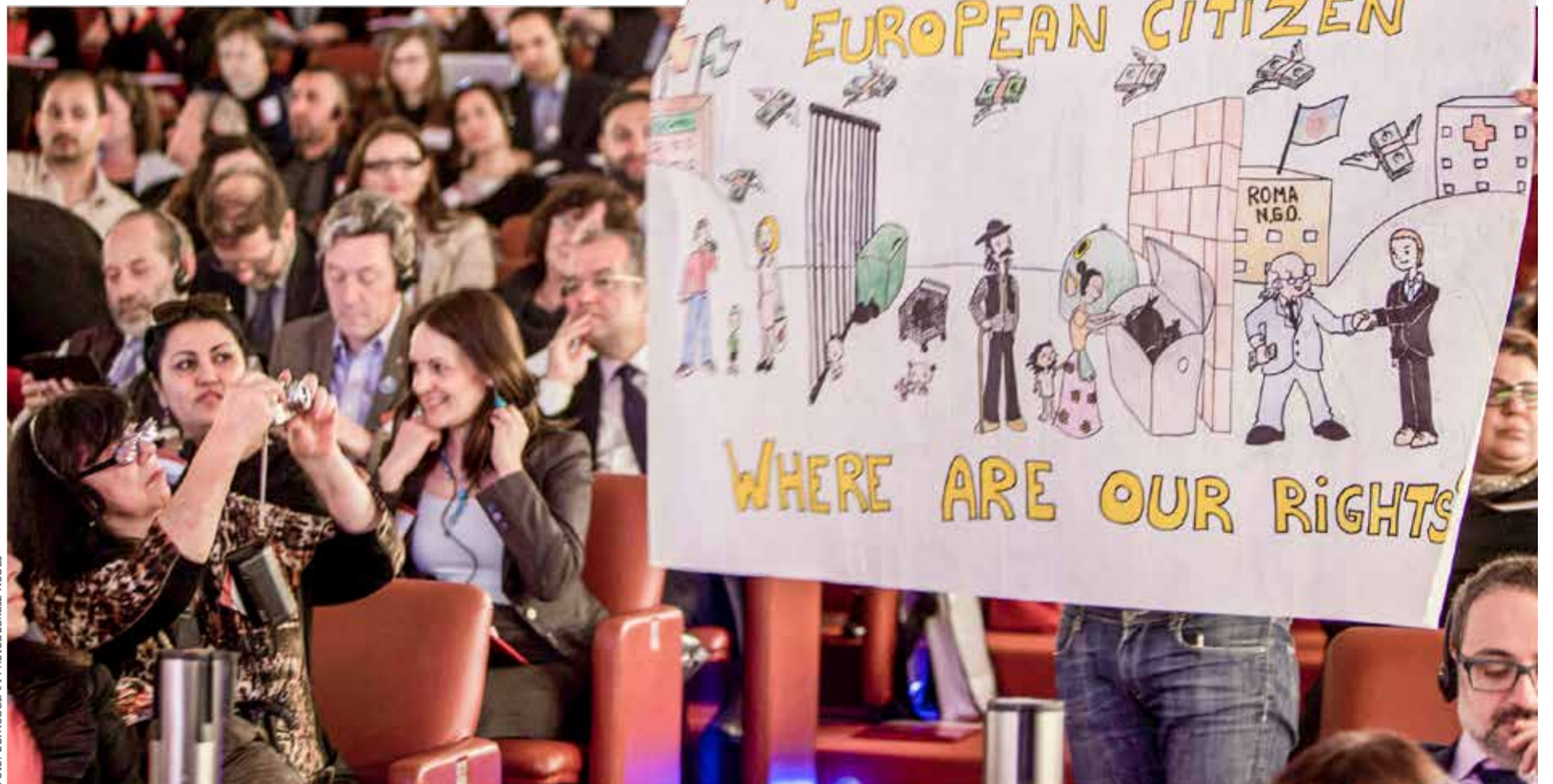
Bei der Europäischen Roma-Konferenz 2014 mit mehr als 500 Teilnehmerinnen und Teilnehmern fragt ein Plakat nach den Rechten der Roma-Minderheit: „We are 12 million European citizen – where are our rights?“