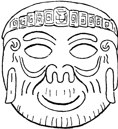
Quetzalcōuātl von Tollan (?), en face — Skizze.

mitternächtigen Baden „an der Stelle, die man Wasserpalast am Ort des Finns (ā-tecpan amochico) nannte“, von Blutabzapfungen mit Edelsteinen und Quetzalfedern, von Rauchopfern aus echten Türkisen, grünen Edelsteinen und roten Muschelkalken und Opfern von Schlangen, Vögeln und Schmetterlingen, von der Verehrung des höchsten Gottespaars To-naca-tecutli und To-naca-ciuātl „unseres Fleisches Herr und Herrin“, die über dem neunten Himmel wohnen. Wir hören von Kunst und Kultur, die Quetzalcōuātl den Menschen brachte. „Er begann auch einen Tempel für sich zu bauen und errichtete (für ihn)