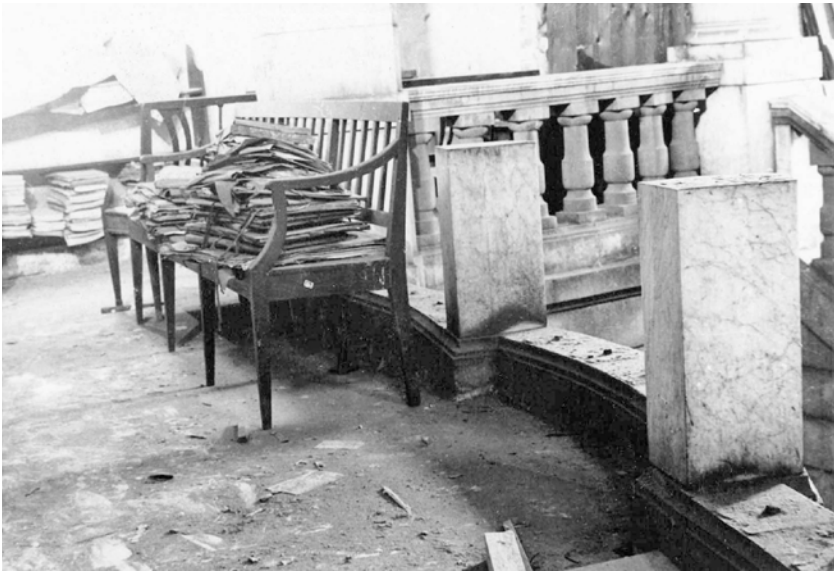
Das zerstörte Treppenhaus der Universitätsbibliothek

Bibliothek, die jährlichen UB-Berichte in der Chronik der (Hessischen) Ludwigs-Universität von 1924 bis 1938 bzw. 1941 7 , ein provisorisches Akquisitionsjournal aus den 40er Jahren, die Kataloge und die Bücher selbst. Detektivische Kleinarbeit war also zu leisten, und hierbei sind es vor allem die Bücher selber gewesen, die sozusagen zum „Sprechen“ gebracht werden mussten. In den gut eineinhalb Jahren Vorbereitungszeit zu der Ausstellung wurden fast 1 km Bücher – Rücken an Rücken gezählt – einzeln auf Spuren nach ihrer Herkunft untersucht, also Stempel, gerade auch solche, die getilgt wurden, Signaturen und handschriftliche Einträge analysiert; das Ergebnis wurde in langen Tabellen dokumentiert und schließlich ausgewertet.