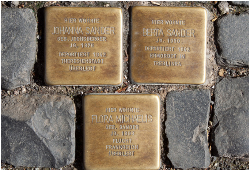
stolpersteine in der Landgrafenstraße 8