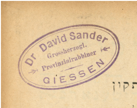
UB Gießen Nr. 757, Besitzstempel David Sander

der Reichstauschstelle und der Preußischen Staatsbibliothek, die als Verteiler für beschlagnahmte Buchbestände fungierten, angeboten bzw. unaufgefordert gelieferten Bücher in den Bestand aufgenommen hat. Beispiele für auf diese oder ähnliche Art ins Haus gekommene Raubgut-Bestände gibt es eine ganze Reihe; häufig ist der Weg, wie diese Bücher in die UB Gießen gekommen sind, im Einzelnen nicht mehr genau nachzuvollziehen.