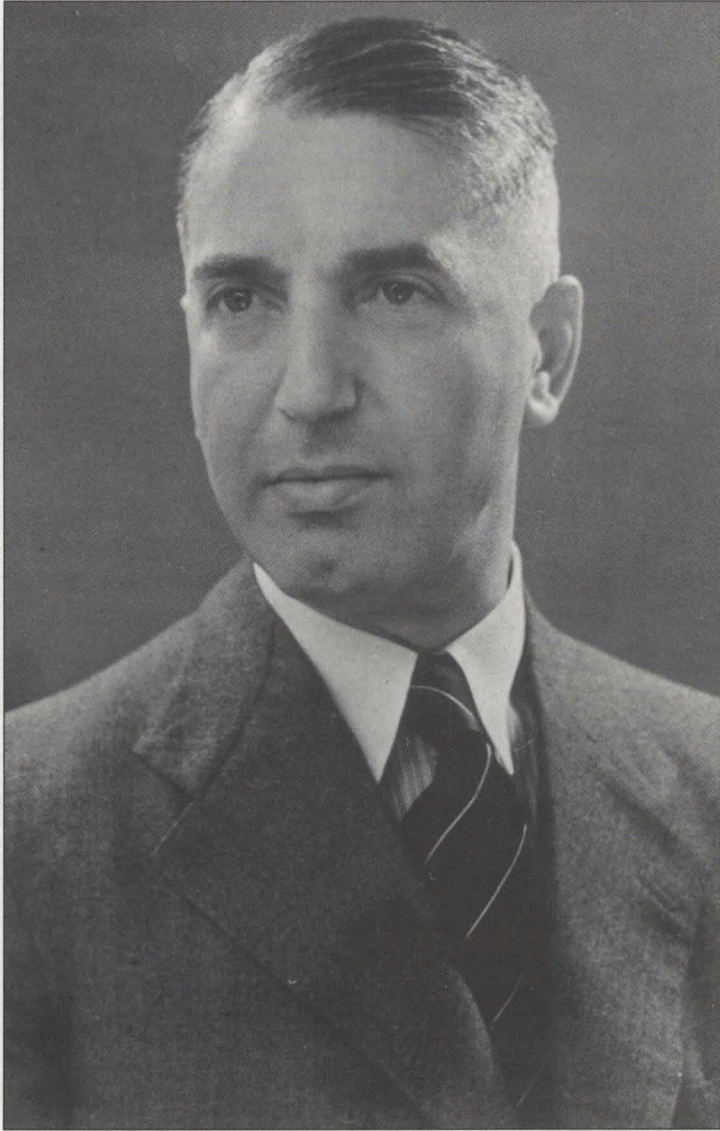
Abb. 14: Porträt ca. 1939.