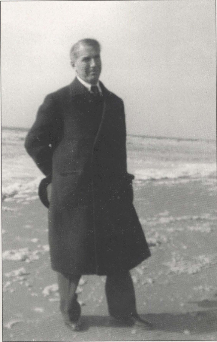
Abb. 15: Noordwijk, Mai 1939.