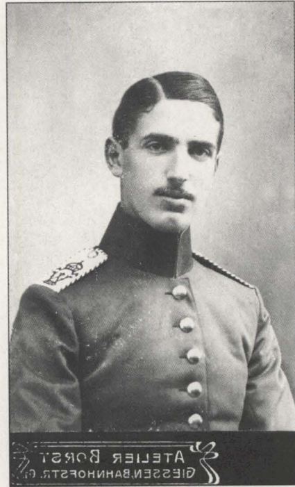
Abb. 8: Im Militärdienst, etwa 1915.