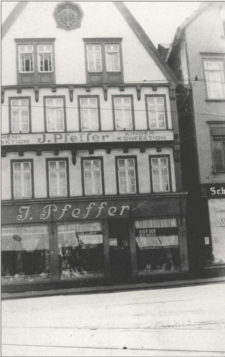
Abb. 3: Das elterliche Geschäft in Gießen, Marktplatz 6.