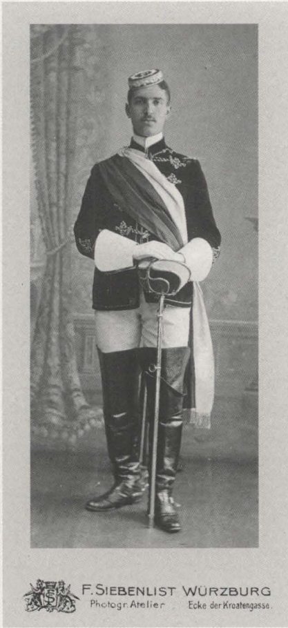
Abb. 7: Als Korporierter in vollem Wicks.