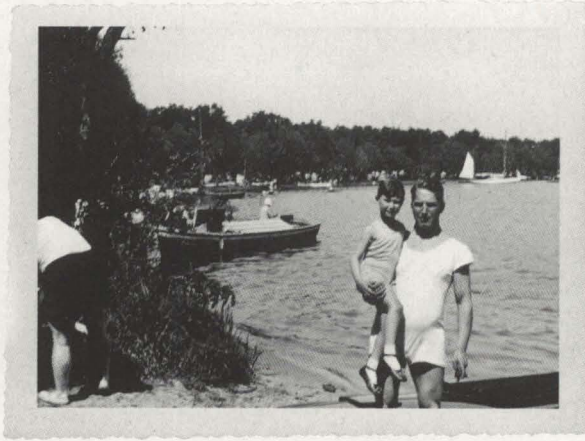
Abb. 9: "Werners erste Bootsfahrt, 15. Mai 1932" steht auf der Rückseite von dieser Aufnahme.