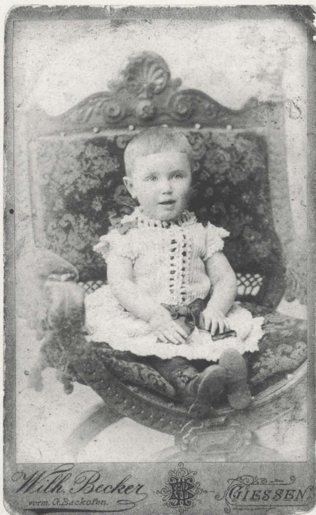
Abb. 5: Fritz Pfeffer wurde am 30. April 1889 in Gießen geboren. Auf diesem Bild ist er drei Jahre alt.