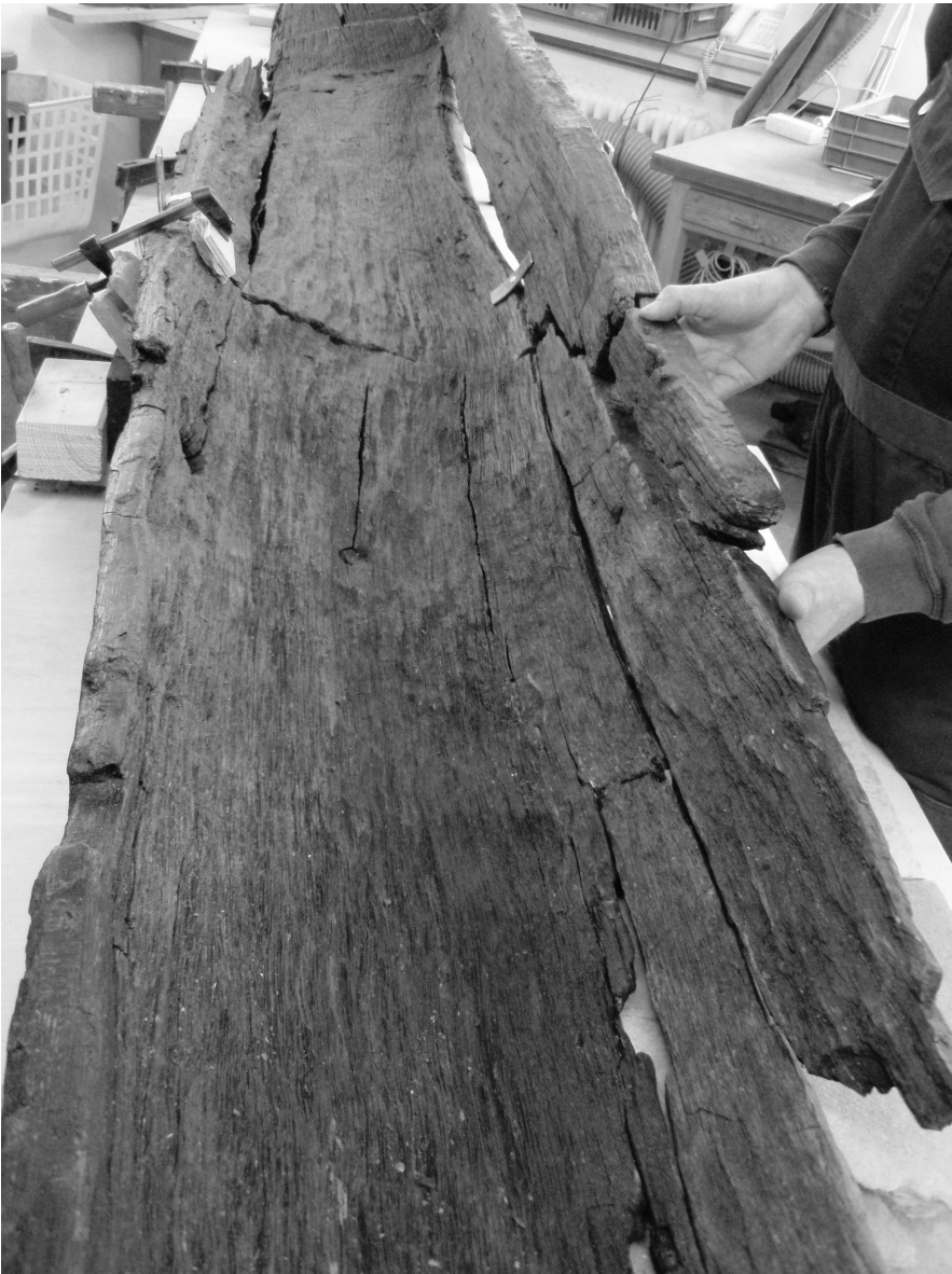
Abb. 4: Restaurierung in der Zentralwerkstatt in Schleswig