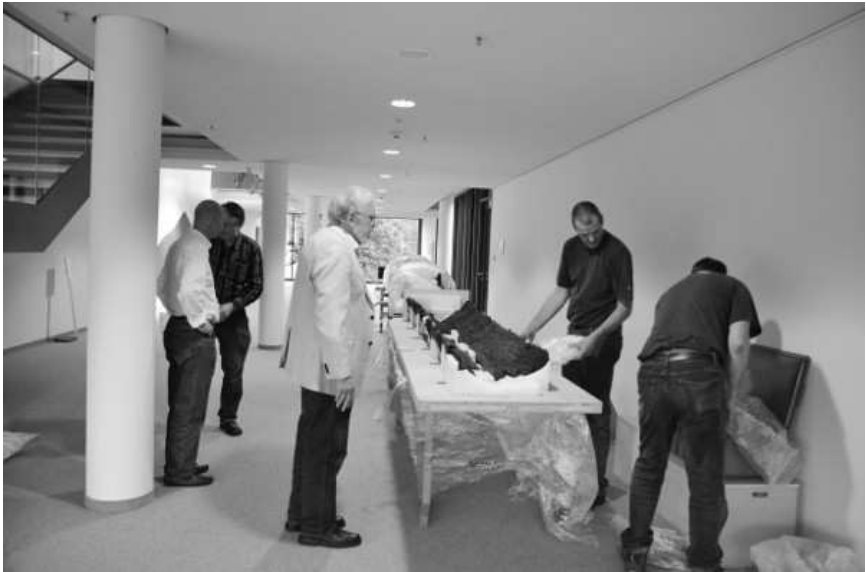
Abb. 5: Zusammenbau in Gießen.