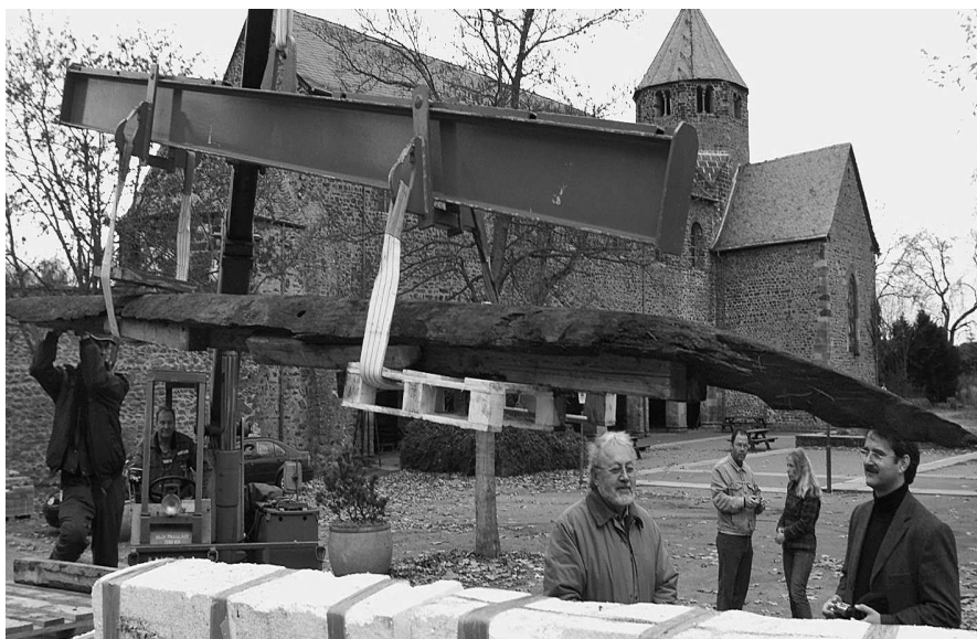
Abb. 1: Transport des Einbaums auf den Schiffenberg am 5.11.2004.