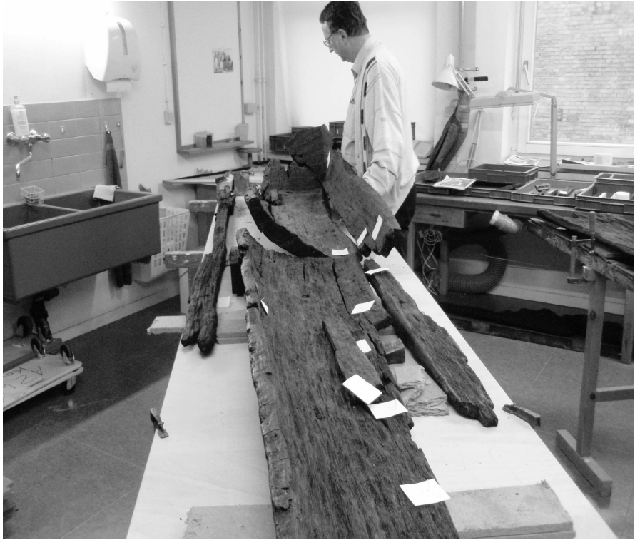
Abb. 3: Restaurierung in der Zentralwerkstatt in Schleswig mit dem Leiter Roland W. Aniol.