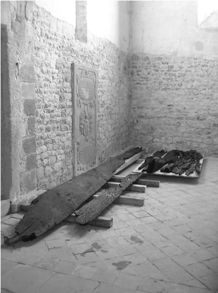
Abb. 2: Zwischenlagerung in der Basilika auf dem Schiffenberg