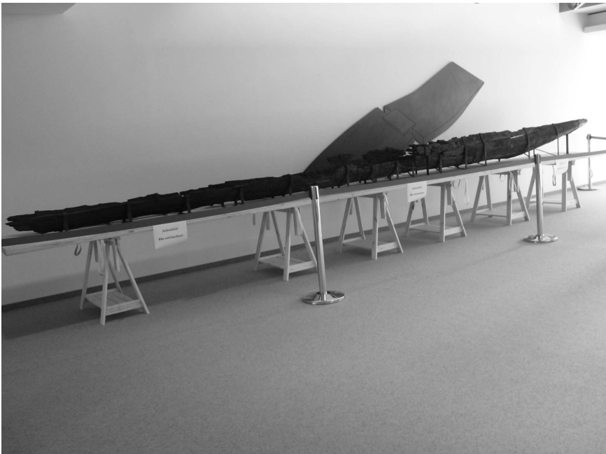
Abb. 6: Derzeitige Präsentation in Gießen.