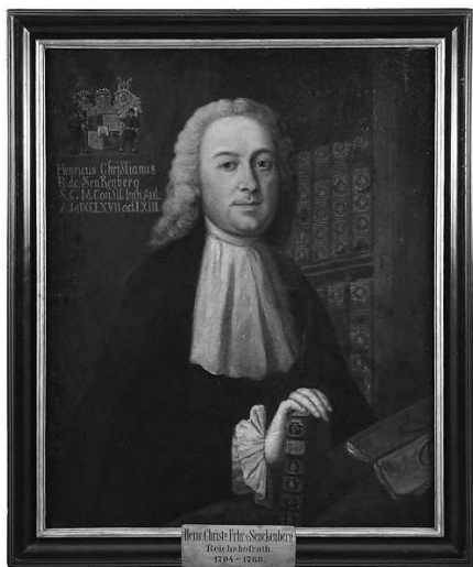
Abb. 3: Heinrich Christian v. Senckenberg