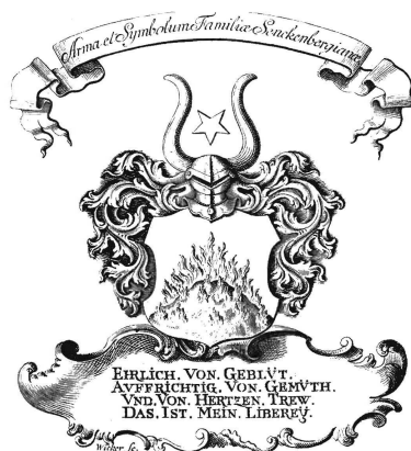
Abb. 11: Wappen des Stiftungsbriefes von Johann Christian Senckenberg