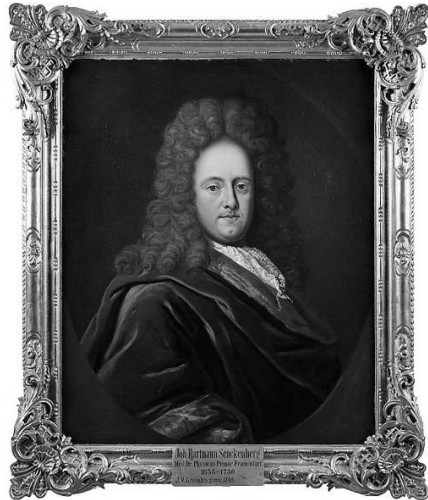
Abb. 1: Johann Hartmann Senckenberg