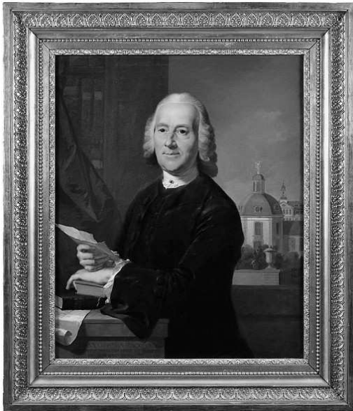
Abb. 5: Johann Christian Senckenberg

schließung merkten sie jedoch, wie wenig Gemeinsamkeiten sie hatten. Nach nur zwei Jahren Ehe trennte sich das Paar. Ein Entschluss, den sein Neffe später einmal lobte, mit der modern anmutenden Begründung, es sei besser sich zu trennen als lebenslang mit einem unpassenden Partner zusammen zu sein. 30 Johann Christians dritte Frau verstarb bald nach der Trennung an Krebs, ihr reiches 31 Erbe schlug er zugunsten des Almosenkastens aus. 32 Durch die schlechte Ehe und die Trennung fühlte er sich scheinbar nicht als Erbe berechtigt. 33 Inzwischen hatte er bereits ein eigenes, stattliches Vermögen erwirtschaftet und ererbt. Johann Christian heiratete nicht mehr, sondern widmete sich voll seinem Beruf. Eine Urlaubswoche in Allendorf/Lumda verbrachte er mit dem Studium der dortigen Botanik, speziell am Hangelstein. 34