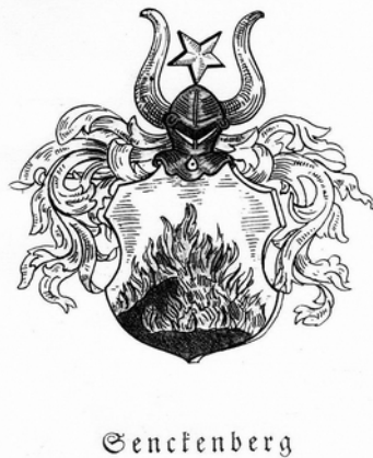
Abb. 9: Wappen der Troppauer Senckenbergs