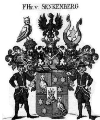
Abb. 10: Reichsfreiberrennwappen der Senckenbergs

damaligen Frankfurter Lebens gehörte auch das Erkaufen des Adels 89 . Der Adelsstand erforderte ein neues Wappen. Die beiden Brüder trugen in ihrem reich unterteilten Wappen 90 unter anderem weiterhin den brennenden Berg und den Stern.