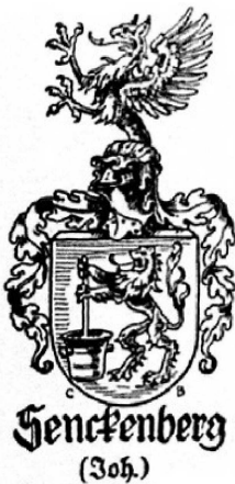
Abb. 8: Wappen der Friedberger Senckenbergs