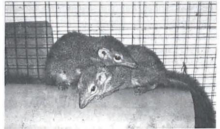
Bild 3: Kontaktliegen eines Tupaia-Paares. Das Weibchen, erkennbar an dem etwas zierlicheren Kopf, liegt hier oben. Die Tiere haben sich eine am Käfiggitter befestigte Röhre als Ruheplatz ausgesucht, weil sie von dort aus einen guten Überblick, u. a. auch auf die Zimmertüre, haben.