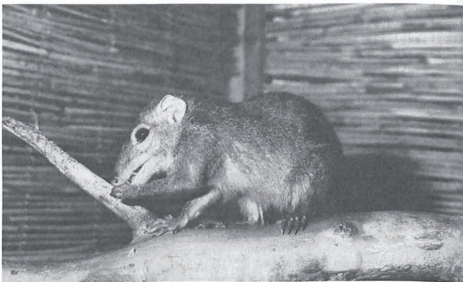
Bild 6: Das Männchen führt ein Futterstückchen mit der Hand zum Maul.

Mit zunehmendem Alter können bei Tupaia eine Reihe spontaner Erkrankungen, wie Diabetes, verschiedene Tumoren, Katarakt und auch psychische Veränderungen auftreten. In einem anderen Zusammenhang sind psychische Veränderungen, bzw. Veränderungen im Verhalten von Tupaia in Zusammenarbeit mit dem SFB 47 (Virologie) untersucht worden. Spitzhörnchen, die experimentell mit dem Virus der Borna-