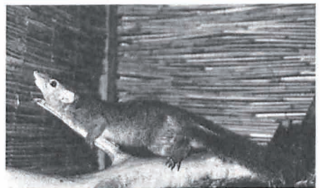
Bild 4: Sogenanntes Sternal-Markieren: Ein Männchen markiert ein vorstehendes Aststück mit seinem Drüsenfeld am Brust-Kehlbereich.