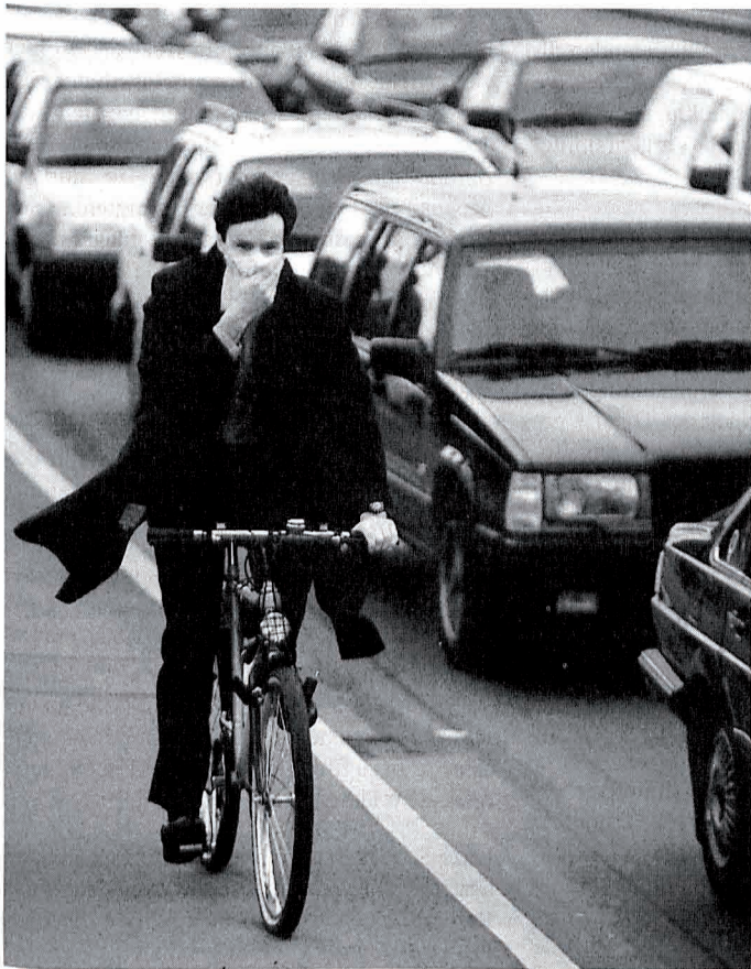
Auch Radfahrer haben es manchmal nicht leicht...