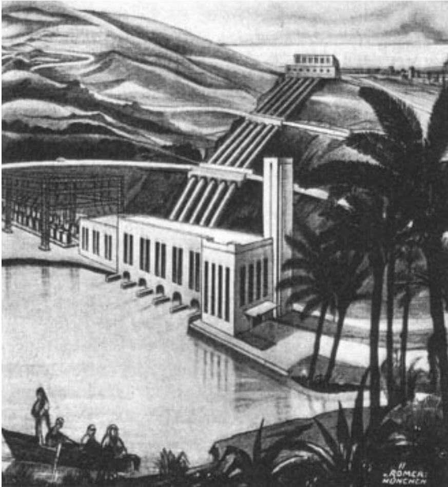
Abb. 5: Im Rahmen des Atlantropa-Plans sollte jede landschaftliche Vorgabe produktiv genutzt und die Wüste zugleich bewohnbar werden.

sem Plan wurde nur ein Teil umgesetzt, der im Lauf der Jahrzehnte zur weitgehenden Austrocknung des Aralsees führte.