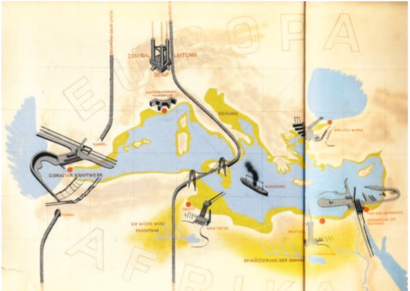
Abb. 4: Seit den ausgehenden 1920er Jahren verfolgte der Münchner Baumeister Herman Sörgel den Plan, einen infrastrukturell zusammenhängenden Großkontinent ‚Atlantropa‘ zu bilden, der Europa und Afrika durch ein teilweise trocken gelegtes Mittelmeer sowie zahlreiche Wasserkraft-Stationen miteinander verbindet. Auch die Sahara sollte dabei wiederbegrünt werden. Quelle: Wolfgang Voigt: Atlantropa. Weltbauten am Mittelmeer. Ein Architekturtraum der Moderne, Hamburg 1998.

Erbe auszuwerten“, so Sörgel weiter, „zersetzt sich Europa im politischen Kleinkrieg. Zuviel negative Organisation – zu wenig positive Produktion! Armeen Arbeitsloser leben von der Substanz!“