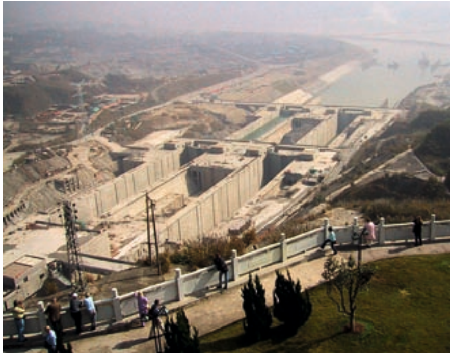
Abb. 1: Schiffsschleusensystem des Drei-Schluchten-Damms während der Bauphase (November 2002)

Dollar kosten und dadurch per Definition zu Makro-Projekten werden. Erinert sei nur an den chinesischen Drei-Schluchten-Damm (Abbildung 1) oder die immer neuen Runden im Wettbewerb um das höchste Gebäude der Welt.