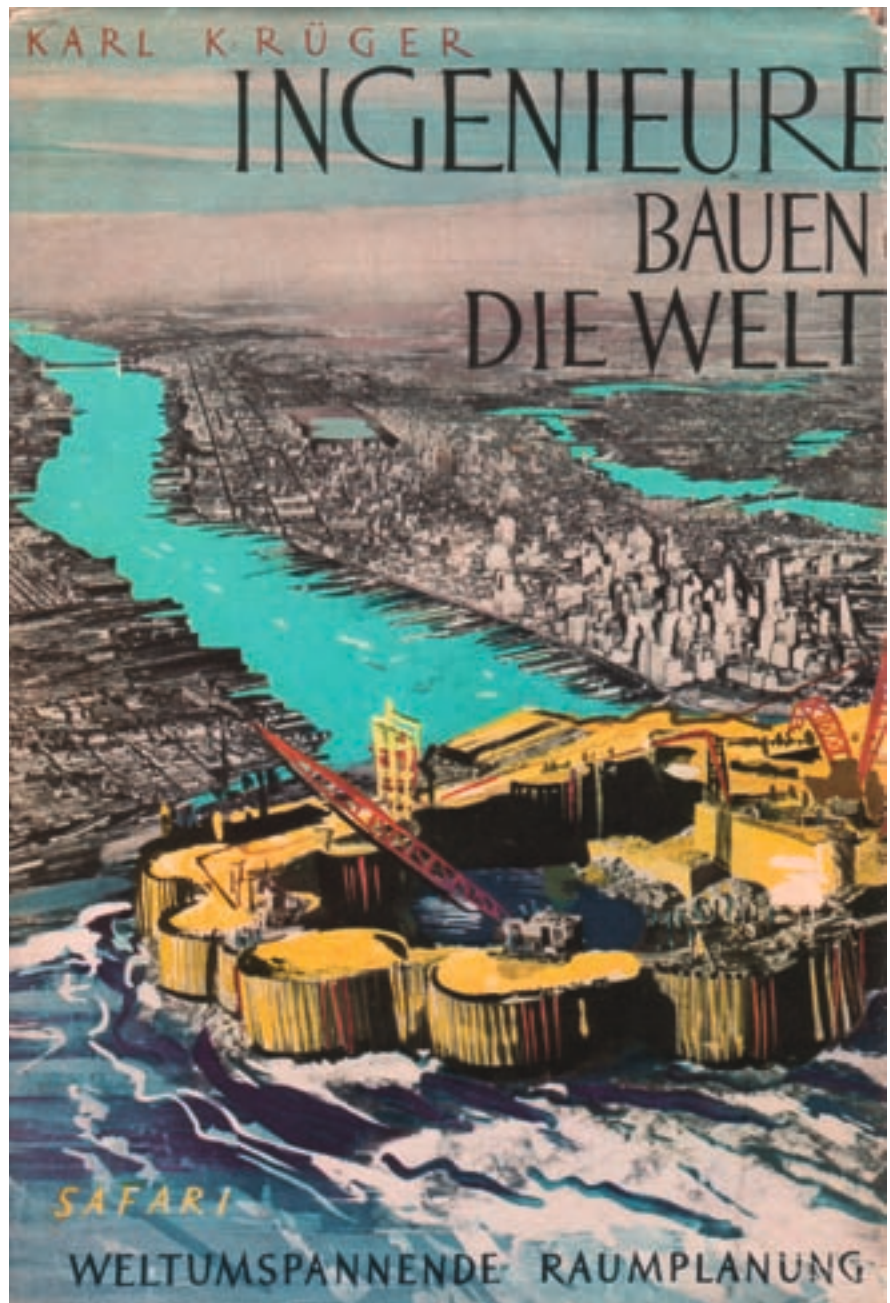
Abb. 3: Auch in den 1950er Jahren wurde unverdrossen geplant. Der Buchtitel signalisiert das Zutrauen in die weltweite Machbarkeit einer optimierten Kulturlandschaft. Quelle: Karl Krüger: Ingenieure bauen die Welt, Berlin 1955, Umschlagbild

In zahllosen technischen Zukunftsromanen wurden solche scheinbar „sinnvollen“ Kolossalprojekte beispielhaft beschrieben und die Figur des genialen Erfinders und Konstrukteurs zu einer Ikone der Moderne erhoben. 1919 forderte der amerikanische Sozio-