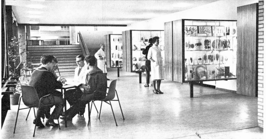
Abb. 5. Im Botanischen Institut

wehren zu müssen gegen das, was andere, mit hintergründigen Zielen, ihm beizubringen versuchen.