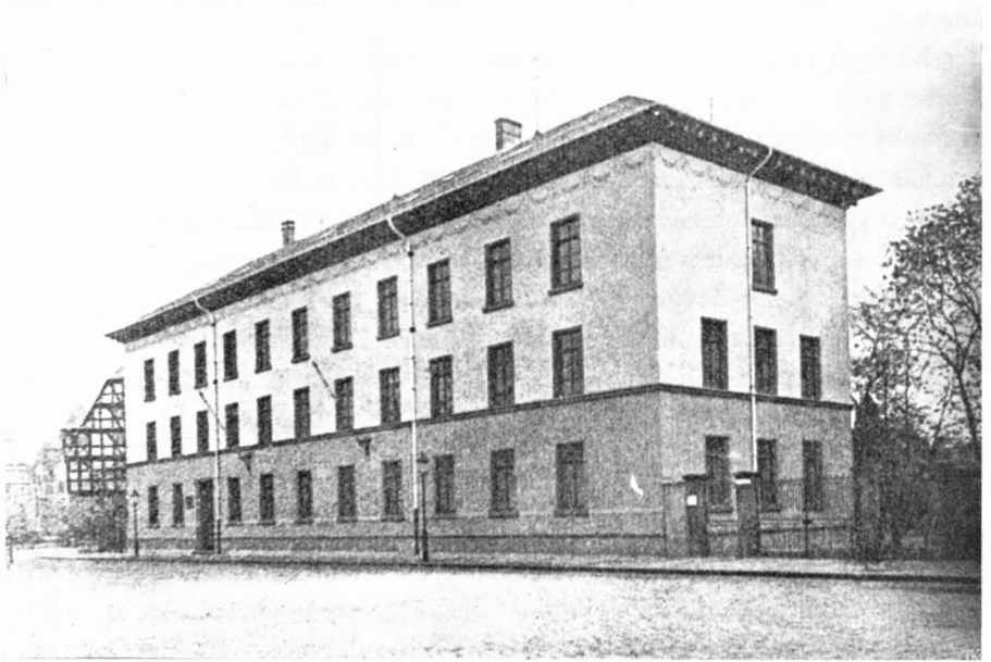
Abb. 1. Das alte Botanische Institut am Brandplatz

Ich habe das alte Botanische Institut am Brandplatz noch selbst erlebt, seine »Aura« noch selbst erfahren, als junger Assistent, der ich damals, 1926, war. Heute noch sind mir meine Empfindungen von damals gegenwärtig. Sieht man von der physiologisch registrierbaren Aura einmal ab — das alte Botanische Institut roch anders als das alte Zoologische Institut — so gab es auch eine irrealen Aura, die von den sorgfältig bewahrten Zeugen früherer Bemühungen in Forschung und Lehre ausging. Es war das Erlebnis einer gewissen Bedrückung, mit so viel Gewesenem zusammen eingesperrt sein zu müssen.