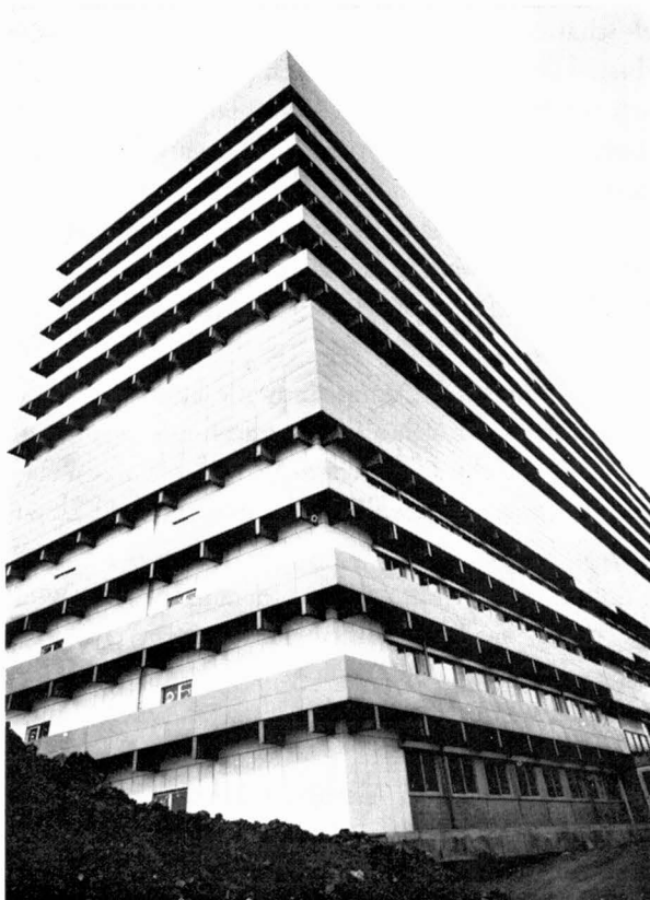
Abb. 3. Wohin wir geraten sind – Neubau der Chemie, 1974

Ich meine die von Ihnen geschaffene Schausammlung, ich meine Ihre Tafelsammlung, ich meine den Stammbaum dort an der Wand, ich meine Ihre Kapitel im Lehrbuch Strasburger . Und wenn ich noch Bibliothek sage, so gehört die des Instituts als umsichtig neu geschaffenes Informationsinstrument