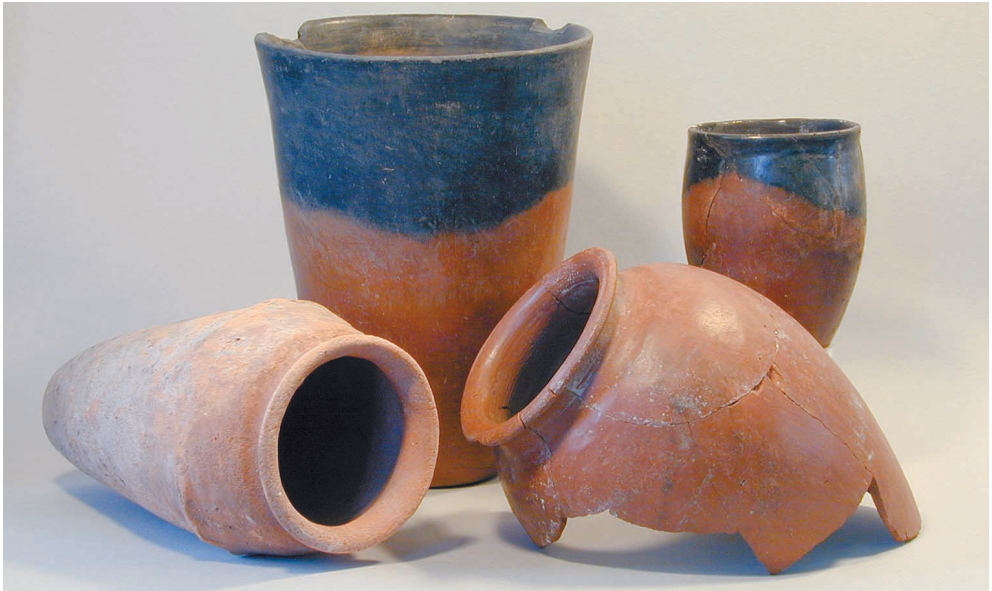
Abb. 2: Eine Auswahl der Vasen aus Abusir el-Meleq, die seit 1987 im Wallenfels'schen Haus ausgestellt sind

Im Archiv der DOG in Berlin ist der Brief erhalten, mit dem der damalige Gießener Archäologe Carl Watzinger (1877–1948) auf die entsprechende Anfrage der DOG reagiert hat. In dem Brief vom 12. 10. 1910 an Bruno Güterbock, den Vorsitzenden der Deutschen Orient-Gesellschaft in Berlin heißt es: