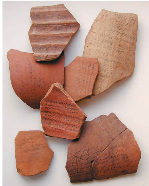
Abb. 10: Ostraka der Gießener Sammlung. Die Tonscherben, zumeist von zerbrochenen Transportamphoren, wurden in der Regel auf der Außenseite beschrieben und tragen Abrechnungen, Quittungen, kurze Briefe oder sonstige Notizen (Inv. 204–206, 546–547)