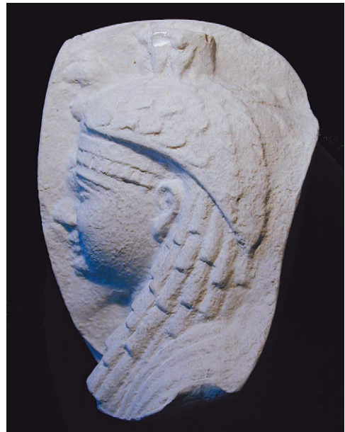
Abb. 7: Ptolemäische Königin oder Prinzessin mit Lökchenperücke und Geierhaube, 2. Jh. v. Chr. Gipsabguss nach Original in Hildesheim, Römer- und Pelizaeus-Museum (Inv. 1174)

Neben den originalen Ägyptiaca befinden sich in Gießen noch etliche neuzeitliche Gipsabgüsse ägyptischer Altertümer. Es handelt sich dabei um fünf Ausformungen von Stuckformen im Museum von Hildesheim. Die Originale wurden im ägyptischen Memphis gefunden und stammen aus hellenistischer und römischer Zeit. Anders als die bisher gesehenen Objekte repräsentieren sie also nicht das Ägypten der Pharaonen, sondern die Phase der Spätzeit, die mit der Eroberung Ägyptens durch Alexander den Großen begann und – mit dem Ende der ptolemäischen Herrschaft nach dem Tod Kleopatras – in eine Epoche überleitete, in der Ägypten ein wichtiger Teil des Imperium Romanum war. Von den Gießener Abgüssen – die ursprüngliche Zahl ist unbekannt – haben fünf Exemplare den 2. Weltkrieg überdauert und sind bis heute im Archäologischen Institut vorhanden (Abb. 7). Der Zeitpunkt ihres Erwerbs