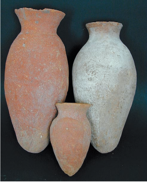
Abb. 3: Vasen aus Beni Hassan, die 1904 als Schenkung von J. Garstang in die Sammlung kamen