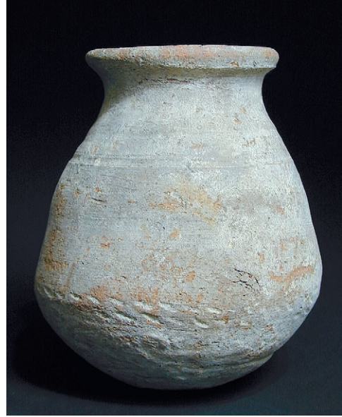
Abb. 4: Dieser mit Schnurabdrücken verzierte Topf aus Beni Hassan gehört ebenfalls zu der Schenkung durch J. Garstang und ist seit kurzem wieder in der Gießener Antikensammlung (Inv. K I-49/03)

Verbindung hat die Universität Gießen wohl die großzügig ausgefallene Schenkung von 1910 zu verdanken.