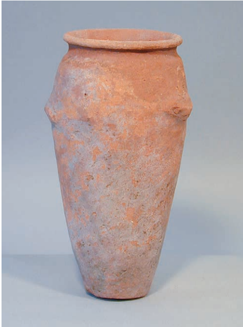
Abb. 1: Wellenhenkelgefäß aus Abusir el-Meleg, 1910 als Schenkung der DOG nach Gießen gelangt, seit 2003 wieder in der Archäologischen Sammlung

Im Wallenfels'schen Haus am Kirchenplatz ist seit 1987 die Antikensammlung der Justus-Liebig-Universität Gießen als Leihgabe ausgestellt. Sie umfasst hauptsächlich Objekte antiker Kleinkunst, antike Vasen aus Griechenland und Unteritalien sowie etliche Stücke aus Zypern und Anatolien. Unter den ausgestellten Stücken befinden sich auch mehrere Objekte aus dem alten Ägypten, zumeist Tonvasen, aber auch einige Statuetten aus Holz und Fayence. Wie diese Objekte aus dem Land am Nil nach Gießen gekommen sind, war bislang jedoch unklar. Neue Forschungen können nun nicht nur die Herkunft der Objekte nachweisen, sondern sogar die Sammlung um zwei weitere Stücke